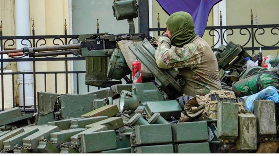
बेलारूस ने क्या डील कराई, प्रिगोजिन को क्या मिलेगा

रूस में गृहयुद्ध और तख्तापलट का खतरा टल गया है। राष्ट्रपति व्लादिमीर पुतिन के खिलाफ बग़ावत करने वाली प्राइवेट आर्मी वैगनर के प्रमुख यैवगेनी वी प्रिगोजिन ने अपने लड़ाकों को वापस लौटने का आदेश दिया है। अब यह प्राइवेट आर्मी अपने कैम्पों की ओर लौट रही है। प्रिगोजिन भी रूस छोड़कर बेलारूस जाएंगे। रूसी मीडिया आरटी के मुताबिक, ये प्राइवेट आर्मी रोस्तोव शहर पर कब्जे के बाद मॉस्को शहर की ओर बढ़ी थी। न्यूयॉर्क टाइम्स के मुताबिक, प्राइवेट आर्मी के पीछे हटने में बेलारूस के राष्ट्रपति अलेक्जेंडर लुकाशेंको का अहम रोल रहा है। लुकाशेंको ने शनिवार देर रात कहा कि मैंने वैगनर प्रिगोजिन और रूस के बीच समझौता कराया है। इसके बाद वैगनर ग़ुप ने अपने सैनिकों को पीछे हटने को कहा है, ताकि खून खराबा रोका जा सके।