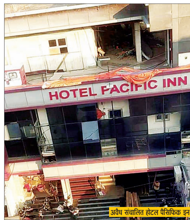
अवैध संचालित होटल पैसिफिक इन

लखनऊ। यूं तो आप दिन राजनैतिक और रसूखदारों द्वारा लोकतंत्र का मजाक बनाया जाता रहा है और न्याय के मंदिर के बाहर मजबूर और बेसहारा लोगों के अधिकारों की बोलियां खुलेआम लगती रहें हैं, साथ ही शासन और प्रशासन बेईमानों के हाथ की कठपुतली बनता नजर आया है। लेकिन जब से उत्तर प्रदेश में मुख्यमंत्री योगी आदित्यनाथ की सरकार बनी है तबसे हर व्यक्ति न्याय की आस में अधिकारियों और राजनेताओं की चौकड़ पर इस उम्मीद से पहुंचने लगा है कि आज नहीं तो कल योगी के राज में उसे न्याय जरूर मिलेगा। इसी उम्मीद से होटल पैसिफिक इन के मालिकों द्वारा प्रताड़ित की गई एक महिला ने अपनी जमीन कब्जा करने के मामले में होटल पैसिफिक इन के मालिक