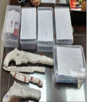
जन एक्सप्रेस। कानपुर नगर

सचेंडी पुलिस ने बीते दिन गुरुवार की रात्रि मुखबिर् की सूचना पर डकैती की योजना बनाने वाले चार शांतिर मोबाइल लुटेरों को गिरफ्तार कर लिया है। वहीं अंधेरे का फायदा उठाकर मौके से एक लुटेरा भाग गया। पुलिस ने शांतिर लुटेरों के पास से 25 मोबाइल,