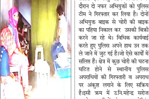
झांसे में आकर लोग भी अपनी जिंदगी दांव पर लगा रहे हैं। लंबे अरसे से इलाज कर रहे बिना डिग्री के डॉक्टर किसी कायदे कानून को भी नहीं मानते उनके लिए डॉक्टरों के लिए किसी डिग्री की जरूरत नहीं। सिर्फ एक्सपीरियंस ही उनका सर्टिफिकेट है। जानकारी के अनुसार क्षेत्र के विभिन्न हिस्सों में बिना डिग्री के चिकित्सक घड़ले से अपनी क्लिनिक चलाते देखे जा रहे हैं। यह चिकित्सक हर मर्ज का इलाज करने में अपने आप को एक्सपर्ट बताकर ग्रामीण व क्षेत्रवासियों के जीवन के साथ खिलवाड़ होता देखा जा रहा है। यह सब भगवान भरोसे है।

बदलते मौसम में विभिन्न बीमारियों का फीवर शुरू होने लगता है। क्षेत्र में कस्बे सहित ग्रामीण क्षेत्रों में कथित तौर पर डॉक्टर कहे जाने वाले झोलाछापों का जाल फैला देखा जा रहा है। क्लिनिक के नाम पर एक टेबल-कुर्सी पर एक व्यक्ति बैठा है। और मरीजों का इलाज करता है। क्लिनिक का नाम क्या है? इलाज करने वाले के पास मेडिकल में क्या डिग्री है? इलाज करने वाले व्यक्ति के क्लिनिक का रजिस्ट्रेशन है या नहीं? यह तो किसी को नहीं पता होता है। इन बिना डिग्री वाले डॉक्टर का इलाज जान पर भारी पड़ सकता है। बिना डिग्री चिकित्सकों द्वारा मरीजों का आर्थिक शोषण करने के साथ ही उनके स्वास्थ्य के साथ खिलवाड़ किया जा रहा है।