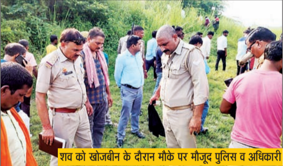
शव को खोजबीन के दौरान मौके पर मौजूद पुलिस व अधिकारी

हसनगंजा। कोतवाली क्षेत्र स्थित सई नदी पुल के नीचे शुक्रवार दोपहर को नहाने गए नवयुवक की गहरे पानी में जाने से डूबकर मौत हो गई। मवेशी चरा रहे चरवाहों ने युवक को डूबते देख परिजनों को सूचना दी। कस्बे के ही चार युवकों ने दो घंटे की कड़ी मशकत के बाद उसका शव ढूंढकर