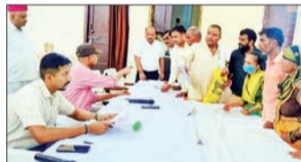
जिलाधिकारी विशाख जी द्वारा फूल बाल भवन में औचक निरीक्षण के दौरान अधिकारियों का एक दिन का वेतन रोकने के निर्देश दिए गए।

जन एक्सप्रेस/कानपुर नगर। जिलाधिकारी विशाख जी द्वारा फूल बाल भवन में चल रहे संपूर्ण समाधान दिवस का औचक निरीक्षण किया गया। औचक निरीक्षण के दौरान 06 विभागों के अधिकारी अनुपस्थित पाए गए। अनुपस्थित पाए गए समस्त 06 विभागों के अधिकारियों का एक दिन का वेतन रोकने के निर्देश उप जिलाधिकारी सदर को दिए। निरीक्षण के दौरान लोगों की समस्याएं सुनते हुए उपस्थित अधिकारियों को निर्देश दिए। समस्त तहसील स्तरीय अधिकारियों को निर्देशित किया गया कि जनसामान्य की शिकायतों का स्थानीय स्तर पर गुणवत्तापूर्ण समाधान करना शासन की मूल प्राथमिकता है। जिसके आधार पर प्राप्त समस्त प्रकार की शिकायतों का समयबद्ध गुणवत्तापूर्ण निस्तारण सुनिश्चित कराया जाए। समाधान दिवस में प्राप्त शिकायतों के त्वरित गुणवत्तापूर्ण निस्तारण हेतु 03 प्रकरणों की आगे ही जांच कर वस्तुस्थिति से अवगत करने के लिए एवं समाधान हेतु संबंधित अधिकारियों को निर्देशित किया गया। संपूर्ण समाधान दिवस में अनुपस्थित पाए गए उप मुख्य चिकित्साधिकारी, सहायक अभियंता लघु सिंचाई, खंड विकास अधिकारी कल्याणपुर, सहायक विकास अधिकारी (पंचायत) कल्याणपुर, तथा सहायक विकास अधिकारी (समाज कल्याण) के वेतन आहरण पर रोक लगाते हुए कारण बताओ नोटिस निर्गत कराए जाने हेतु उप जिलाधिकारी सदर को निर्देशित किया गया। इस अवसर पर उप जिलाधिकारी अभिनव गोपाल, तहसीलदार सदर सहित अन्य संबंधित विभागों के जनपद स्तरीय अधिकारीगण उपस्थित रहे।