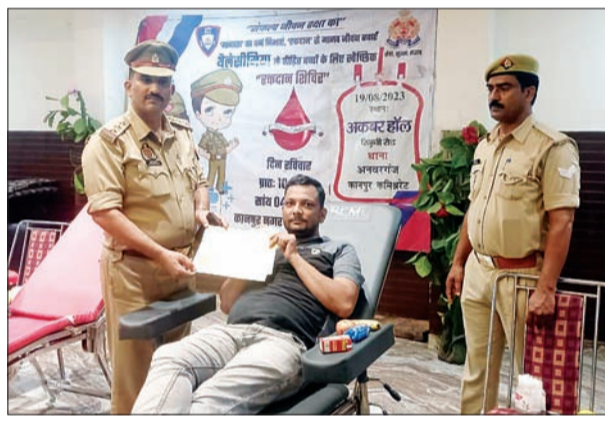
कानपुर पुलिस कमिश्नरीट द्वारा लगातार रक्तदान शिविर का आयोजन किया जा रहा है।