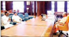
जन एक्सप्रेस | जौनपुर