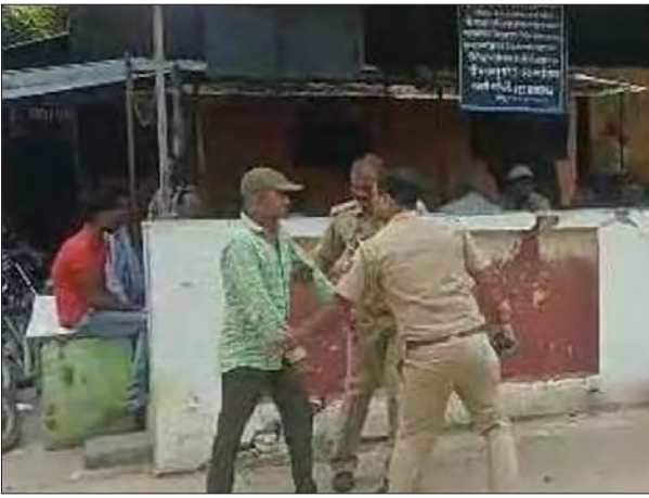
आरोपी को देखकर पुलिस ने तत्काल उसे हिरासत में लिया।

जिला एवं सत्र न्यायालय में बीते शनिवार को पेशी पर लाया गया एनडीपीएस एक्ट का आरोपी पुलिस को चकमा देकर अभिरक्षा से फरार हो गया था। जिसकी गिरफ्तारी के लिए पुलिस की 4 टीमें गठित की गई थी, जो लगातार दबिश दे रही थी। यहां भी आरोपी पुलिस को चकमा देकर एनकाउंटर की डर से कोंच कोतवाली में सरेंडर करने पहुंचा गया।