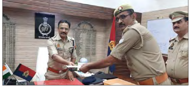
जन एक्सप्रेस | रायबरेली

शुक्रवार को पुलिस अधीक्षक रायबरेली द्वारा पुलिस लाइन मैस में जवानों को लगातार गुणवत्तायुक्त स्वादिष्ट भोजन बनवाकर कमाने के फलस्वरूप रिजर्व पुलिस लाइन