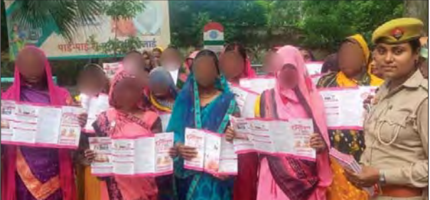
जन एक्सप्रेस | अमेठी

शुक्रवार को पुलिस अधीक्षक के निर्देशन, अपर पुलिस अधीक्षक के पर्यवेक्षण में मिशन शक्ति अभियान के तहत नारी सुरक्षा, नारी स्वावलंबन हेतु महिलाओं एवं बालिकाओं में सशक्तिकरण व विश्वास का वातावरण बनाने के उद्देश्य से जनपद के विभिन्न थानों द्वारा अपने-अपने थाना क्षेत्र के विभिन्न विद्यालयों एवं गांवों में जाकर चौपाल लगाकर जागरूक किया गया। महिलाओं, बालिकाओं को वीमेन पॉवर लाइन, महिला हेल्प लाइन, एम्बुलेंस सेवा, मुख्यमंत्री हेल्पलाइन, पुलिस आपात कालीन