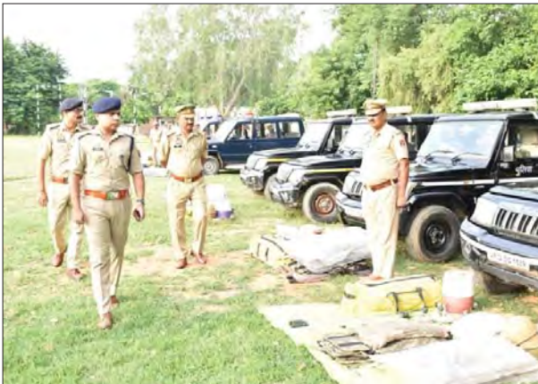
देखरेख व कुशल संचालन का निर्देश दिया। परेड के दौरान पुलिसकर्मियों से शस्त्र संचालन व शस्त्र का अभ्यास