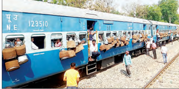
खराबी हो गई। जिसके कारण फर्रुखाबाद की तरफ से आ रही कोलकाता आगरा एक्सप्रेस ट्रेन वही रुक गई।

बीते दिन शुक्रवार को रेलवे की हाई टेंशन लाइन में खराबी के कारण यात्रियों को काफी परेशानी उठनी पड़ी। हाई टेंशन लाइन में खराबी होने की वजह से कई गाड़ियां अपने स्थान पर रुक गईं।