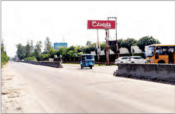
कानपुर शहर के नामी-गिरामी उद्योगपतियों के बच्चे शिक्षा ग्रहण करने आते हैं। लेकिन विद्यालय प्रशासन को ना तो विद्यालय में पहुंचने

कल्याणपुर बिदूर रोड पर आधा दर्जन से अधिक प्राइवेट स्कूल संचालित हैं। इन स्कूलों के प्रबंधन तंत्र में विद्यालय से निकलने वाले वाहनों की सुविधा को ध्यान में रखते हुए स्कूल के गेट के सामने डिवाइडर को काटकर रास्ता बना रखा है। जोकि वहां से निकलने वाले अन्य मुसाफिरों के लिए मौत का रास्ता साबित होता जा रहा है। आए दिन किसी न किसी राहगीर का भयंकर एक्सीडेंट होता ही रहता है। आपको बताते चलें कल्याणपुर बिदूर रोड पर आधा दर्जन से अधिक हाई प्रोफाइल प्राइवेट स्कूल संचालित हैं। इन स्कूलों में