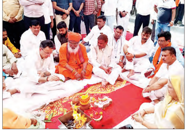
अक्षर में लिखा जायेगा। आज देश में तेजी से परिवर्तन हो रहा है इसमें

लोक निर्माण मंत्री ने अजगैन क्रॉसिंग के फ्लॉयड ओवर का भूमि पूजन कर किया शिलान्यास