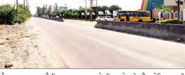
चोटहिल हो रहे हैं। लेकिन इतनी घटनाओं के बाद भी अभी तक ना तो जिला प्रशासन ने इन शॉर्टकट रास्ता को बंद कराया है और ना ही अपार्टमेंट व विद्यालयों के मालिकों ने ही शॉर्टकट बंद किए हैं। जन एक्सप्रेस समाचार पत्र लगातार जिला प्रशासन को इन शॉर्ट कट रास्तों को बंद करने के लिए जगता भी रहा है लेकिन अभी तक जिला प्रशासन नहीं जगा है। ऐसा लगता है कि कानपुर जिला प्रशासन को किसी बड़ी घटना का इतजार है।

कानपुर नगर। कल्याणपुर बिदूर रोड पर शहर के नामी ग्रामीण विद्यालय संचालित है। साथ ही साथ आसमान को छूती इमरती बनी हुई है। इन इमारत को बनाने वाले बिदूरों ने गेट के सामने ही डिवाइडर को तोड़कर रास्ते का निर्माण कर दिया है। इसके अलावा आधा दर्जन से अधिक संचालित विद्यालयों के प्रबंध तंत्र ने भी विद्यालय के गेट के सामने डिवाइडर को काटकर विद्यालय से निकलने वाले वाहनों के लिए शॉर्टकट रास्ता तैयार कर दिया है। जो अंध वहां से निकलने वाले राहगीरों के लिए मौत का शॉर्टकट बन गया। आपको बताते चलें कल्याणपुर बिदूर रोड पर आपा दिन एक्सप्रेसट होते ही रहते हैं। इतना ही नहीं इन एक्सप्रेसटों से कई मोटे भी हो चुकी है। इन सभी घटनाओं के पीछे एक ही वजह है।