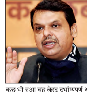
कुछ भी हुआ वह बेहद दुर्भाग्यपूर्ण था। हमले में निंदोप लोग घायल हो गये। मैं सरकार की ओर से माफी मांगता हूँ।

महाराष्ट्र सरकार ने जालना जिले में मराठा आरक्षण की मांग कर रहे प्रदर्शनकारियों पर शुक्रवार, 1 सितंबर को लाठीचार्ज के लिए माफी मांगी है। सोमवार को मराठा आरक्षण को लेकर कैबिनेट सब-कमेटी की बैठक के बाद सीएम एकांत शिंदे, डिप्टी सीएम देवेन्द्र फडणवीस और अजित पवार ने प्रेस कॉन्फ्रेंस की। इस दौरान देवेन्द्र फडणवीस ने कहा- जालना में जो