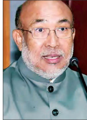
असम

मणिपुर के मुख्यमंत्री जन बिरन सिंह ने सोमवार 4 सितंबर को एडिटर्स गिल्ड