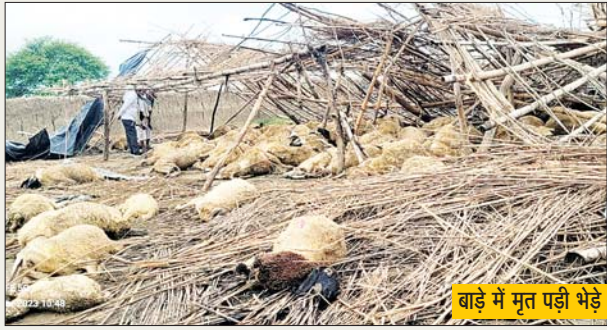
बाड़े में मृत पड़ी भेड़ें