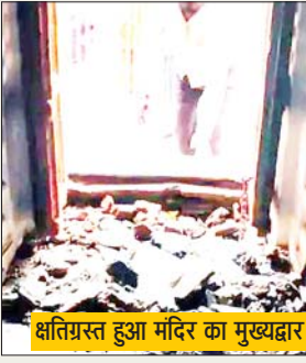
क्षतिग्रस्त हुआ मंदिर का मुख्यद्वार