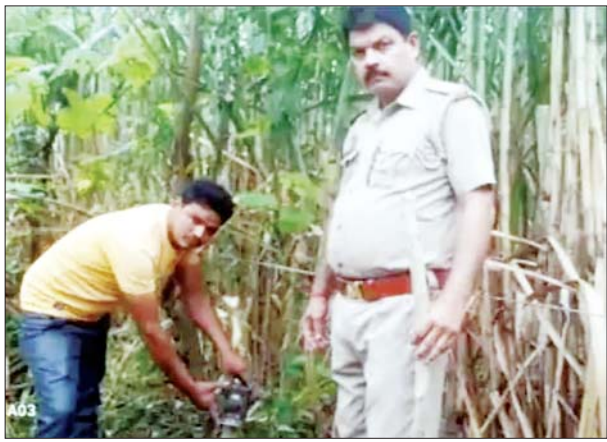
सांस ली थी। वहीं बीती रात पुनः एक तेंदुए ने सुजई कुण्डा पंडित पुरवा मार्ग पर दुबगल पुल के पास घूम रही एक

लखीमपुर खीरी। खमरिया के उत्तर खीरी वन रेंज धौरहा क्षेत्र में बीती रात सुजई कुण्डा मार्ग पर तेंदुए ने एक गाय को निवाला गा लिया। मार्ग से गुजर रहे ग्रामीण उसे देखकर खौफजदा हो गए। ग्रामीणों की आहट पाकर तेंदुए गाय को छोड़कर गत्रे के खेत में जाकर छुप गया। वन विभाग की टीम ने लोगों को सावधानी बरतने को कहा है। नाइट विजन कैमरे लगाने का काम शुरू कर दिया है। धौरहा वन रेंज में एक सप्ताह पहले ही दहशत का पर्याय बने एक नर तेंदुए को वन विभाग ने पकड़कर दुधवा के जंगल में छोड़कर राहत की