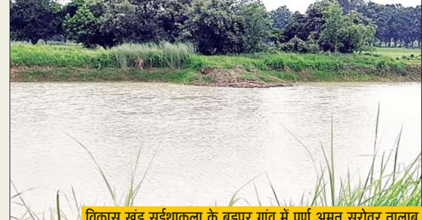
विकास खंड सुईथाकला के बसुपुर गांव में पूर्ण अमृत सरोवर तालाब

कुछ भी कार्य दिखाई नहीं दे रहा है। यही नहीं कागजों में सब बनकर तैयार