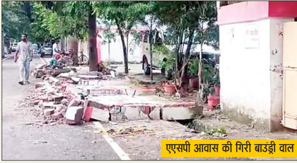
एसपी आवास की गिरी बाउंड्री वाल