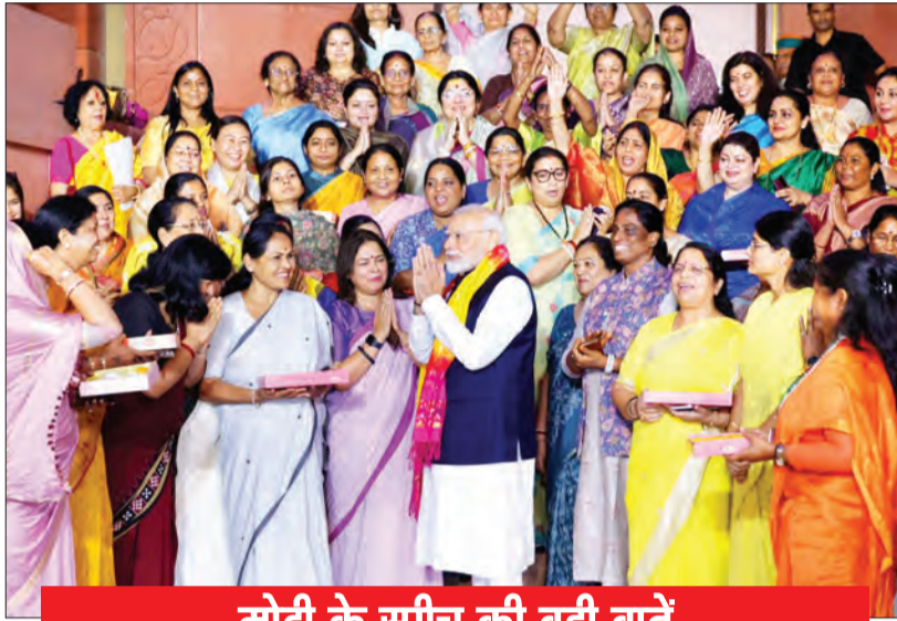
मोदी के स्पीच की बड़ी बातें

महिला आरक्षण बिल (नारी शक्ति वंदन विधेयक) लोकसभा और राज्यसभा से पास होने के बाद शुक्रवार को भाजपा ने दिल्ली मुख्यालय में जयन मनाया। महिला कार्यकर्ताओं ने पीएम नरेंद्र मोदी का अभिनंदन और आभार व्यक्त किया। इस मौके पर पीएम ने महिला कार्यकर्ताओं के पैर छूकर आशीर्वाद दिया। मोदी ने 40 मिनट की स्पीच में कहा, मैं आज देश की हर माता-बहन और बेटों को बहुत-बहुत बधाई देता हूँ। कल और परसों 20 और 21 सितंबर को हम सबने एक नया इतिहास बनते देखा है। हम सबका सौभाग्य है कि ये अवसर हमें मिला है। आने वाली हर पीढ़ी तक इस दिवस की और इस निर्णय की चर्चा होगी। उन्होंने कहा कि लोकतंत्र में महिलाओं की भागीदारी के लिए, इस कानून के लिए भाजपा तीन दशक से कोशिश कर रही थी। ये हमारा कमिटमेंट था। इसे हमने पूरा करके दिखाया है। जब पूर्ण बहुमत की सरकार होती है, तो ऐसे ही मजबूत फैसले लिए जाते हैं। उधर, भाजपा कार्यालय के बाहर सुबह से ही बड़ी संख्या में महिला कार्यकर्ता पहुंचने लगी थीं।