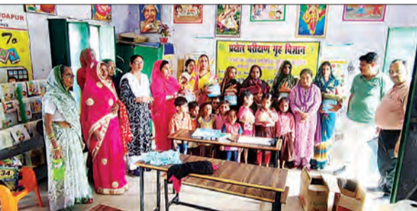
का सेवन सेहत के लिए काफी फायदेमंद होता है। अंकुरित अनाज में विटामिन की भरपूर मात्रा होती है। प्रोटीन, विटामिन, मिनरल्स, फाइबर, फास्फोरस, मैग्नीशियम, आयरन और मैग्नीशियम से भरपूर स्पाउटस का सेवन न सिर्फ दिन भर की ऊर्जा प्रदान करता है बल्कि अपने पोषक तत्वों के कारण कुपोषण निवारण का भी साधन