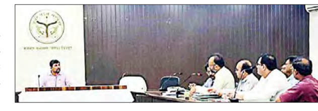
के अंदर कार्य पूर्ण हो जाना चाहिए। उन्होंने कहा कि राजापुर का नाला निर्माण का कार्य जल्द से जल्द पूर्ण कराएं। उन्होंने कहा कि यमुना पुल से लेकर ट्रैफिक चौराहा तक सभी गड्डा मुक्त होना चाहिए। लोक निर्माण विभाग प्रांतीय खंड से मुख्य सड़क व गांव की सड़कों के बारे में जानकारी ली। उन्होंने कहा कि बेड़ी पुलिया से लेकर सूरजकुंड की जो सड़क है, उसे ठीक कराएं। दरदी माफी व बहिलपुरवा देवांगन रोड पुरी ध्वस्त है, इसे ठीक कराएं। उन्होंने कहा कि मऊ से ग्राम पंचायत ताड़ी तक का मार्ग खराब है, उसे सही कराएं। सरैया से बोड़ी पोखरी तक का रोड खराब है उसे ठीक कराएं। साथ ही चैड़ीकरण के लिए प्रस्ताव बनाकर भेजें। उन्होंने कहा कि बारहड़ तक सभी पंचायत के लिए रोड जाती है, उसको भी ठीक कराएं। उन्होंने पीएमजेएसवाई के एई विनोद कटिहार के बैठक में उपस्थित न होने पर एक दिन का वेतन रोकने के लिए निर्देशित किया। उन्होंने कहा कि एक भी गड्डे दिखाई नहीं देना चाहिए। उन्होंने मंडी परिषद, जिला पंचायत, नगर पालिका की सड़कों को उन्होंने सभी अधिशासी अधिकारियों को निर्देशित किया कि चिन्हित कर उसे ठीक कराएं। इस मौके पर अधिशासी अभियंता प्रांतीय खंड सरयेंद्र नाथ, अधिशासी अभियंता सीडी कृष्ण कुमार, एन एच प्रयागराज विजय सिंह आदि मौजूद रहे।

जिलाधिकारी अभिषेक आनंद की अध्यक्षता में लोक निर्माण विभाग द्वारा कराए जा रहे निर्माण कार्य एवं गड्डा मुक्त के सम्बन्ध में बैठक जिला कलेक्टर सभागार में हुई। बैठक में जिलाधिकारी ने एनएच बांदा के भरोसे न रहे, स्वयं जाकर देखें। उन्होंने मंदाकिनी नदी से बेड़ी पुलिया तक हो रहे नाला निर्माण में कहा कि आप लोग लोकल लोगों से समन्वय बनाकर कुछ जगहों पर रैंप व इंटरलॉकिंग बनवाएं। उन्होंने कहा कि इसकी देखरेख के लिए अभियंता प्रांतीय खंड व उप जिलाधिकारी के निर्देशन में एक टीम बनाई जाए जो पंचायत ताड़ी तक का मार्ग खराब है, उसे सही कराएं। सरैया से बोड़ी पोखरी तक का रोड खराब है उसे ठीक कराएं। साथ ही चैड़ीकरण के