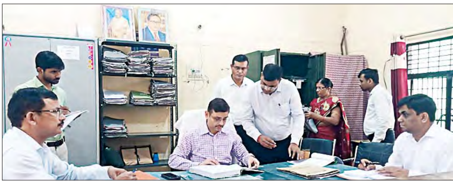
लंबित वादों में उप जिलाधिकारी व तहसीलदार की जवाब देगी तय होगी। उन्होंने भूलेख कक्ष, राजस्व अभिलेखागार, नजारत संग्रह, अनुभाग रजिस्ट्रार कानूनगो आदि पटलों का निरीक्षण करते हुए संबंधित अधिकारियों को आवश्यक दिशा निर्देश दिए। उन्होंने कर्मचारियों की सेवा पुस्तिका, जीपीएफ पासबुक, संपत्ति रजिस्ट्रार, अमलदरमत्त रजिस्टर के बारे में जानकारी ली। जिसमें अभिलेखों की एंटी व सर्विस बुक अपडेट न मिलने पर कड़ी फटकार लगाई। उन्होंने विद्युत देय रजिस्टर देखा जिसमें राजस्व वसूली

मंडलायुक्त आदर्श सिंह ने तहसील जालौन का मुआयना किया। मुआयना के दौरान उप जिलाधिकारी, तहसीलदार व तहसीलदार न्यायिक के कोर्ट पर चल रहे वादों से संबंधित पत्रावलियों का साथ ही मुकदमों के ऑनलाइन फीडिंग का भी निरीक्षण किया। उन्होंने निर्देशित करते हुए कहा कि कोर्ट में लंबित वाद न रहे प्राथमिकता से लंबित प्रकरण का निस्तारण करें। उन्होंने फाइलों का रखरखाव और वादों के निस्तारण पर विशेष जोर दिया। उन्होंने कहा कि अविवाहित मामलों का तत्काल निस्तारण किया जाए। अनावश्यक