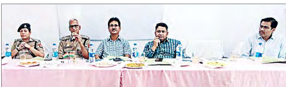
और कहा कि जनता की समस्याओं का समय से समाधान करें तथा अपने काम को पूरी जिम्मेदारी से करें। जिलाधिकारी ने कहा कि अपन

फीता काटकर किया। इस अवसर पर मंडलायुक्त ने कहा कि राजस्व विभाग की भूमिका बहुत अहम होती है एवं चकबंदी विभाग ऐसा विभाग होता है जिसमें भूमि के संबंध में बहुत अच्छी जानकारी होती है। उन्होंने कहा कि आप लोग बहुत जिम्मेदारी वाले पद पर हैं अपने कार्य को जिम्मेदारी और पूरी लगन के साथ करें। डीआईजी ने कहा कि तहसील स्तर पर जितने भी प्रकरण आते हैं इन सभी को राजस्व विभाग और पुलिस विभाग के कर्मचारी मिलकर निस्तारित करते हैं।