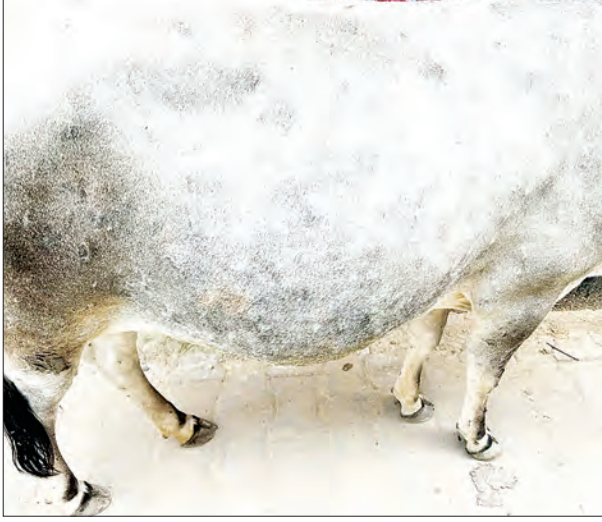
जानवरो से मक्खी, मच्छर, एवं अन्य

बीमारी फैला सकते हैं। इसके अतिरिक्त, संक्रमित जानवरों के सीधे संपर्क में आने से स्वस्थ जानवरों भी इस बीमारी कि चपेट में आ सकता है। बताया जा रहा है कि इस बीमारी का फैलाव भारत के 15 राज्यों में हो चुका है। इस बीमारी में पशुओं को बचाने हेतु लक्षण आधारित इलाज ही एकमात्र उपाय है। इस बीमारी मे शरीर पर गाँठों का बनना, खुर्चा आना, वजन में गिरावट, नेत्रों से पानी गिरना, दूध कम देना और भूख का कम लगना जैसे मुख्य लक्षणों को देखा जा सकता है। आपको बता दें कि संक्रमित पशु को कम से कम कार हफ्तों के लिए अन्य पशुओं से अलग कर देना चाहिए और लक्षणों के आधार पर