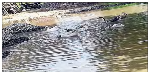
अंदमऊ, बेसडी, प्रेम मऊ कटरा, असोथर, झाल, जरीली, सरकंडी, मनावा, घासीपुर पुरवा, बडवा, नरैनी, रायपुर भस्रोल, मोगरहापुर, लोदौरा, बरौली, जगतपुर, बहेरा, बरैची, सेलरहा, सीटियानी, विजयीपुर आदि गांव तीन दसकों से अंतिम पायदान पर खड़े हैं। ये गांव बदहाल मार्ग के कारण आए दिन दुर्घटना बाहुल्य क्षेत्र बन गया है। इस राज्य कार्य के निर्माण हेतु महात्मा गांधी की जयंती से अनिश्चित कालीन सत्याग्रह गाजीपुर-