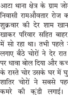
मांग कर अपना भरण पोषण करता है। पाई- पाई जोडकर उसने सवा तोले की सोने की एक झुमकी खरीदी थी ताकि भविष्य में वह उसके काम आ सके