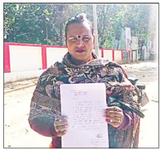
मांग कर अपना भरण पोषण करता है। पाई- पाई जोडकर उसने सवा तोले की सोने की एक झुमकी खरीदी थी ताकि भविष्य में वह उसके काम आ सके