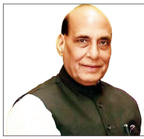
रक्षामंत्री राजनाथ सिंह शुक्रवार दो दिवसीय दौरे पर कानपुर पहुंचे। उनके कानपुर एयरपोर्ट पर उतरने के बाद सबसे पहले शहर के श्याम नगर स्थित हरिहरधाम अपने धार्मिक गुरु संतोष कुमार द्विवेदी से मुलाकात की। फिर वहां से सर्किट हाउस पहुंचे। इसके बाद रक्षा मंत्री

कानपुर नगर। रक्षामंत्री राजनाथ सिंह शुक्रवार दो दिवसीय दौरे पर कानपुर पहुंचे। उनके कानपुर एयरपोर्ट पर उतरने के बाद सबसे पहले शहर के श्याम नगर स्थित हरिहरधाम अपने धार्मिक गुरु संतोष कुमार द्विवेदी से मुलाकात की। फिर वहां से सर्किट हाउस पहुंचे। इसके बाद रक्षा मंत्री