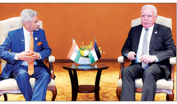
नई दिल्ली

विदेश मंत्री जयशंकर ने युगांडा दौरे पर 'भारत विश्वमित्र' की बात दोहराई है। उन्होंने भारत की नीति का जिक्र करते हुए कहा कि जबरन देशों को मदद के लिए देश हमेशा तय रहता है। उन्होंने कहा कि भारत ने जी20 की अध्यक्षता के दौरान दिखाया कि परिवर्तन संभव है। उन्होंने कहा कि विश्व व्यवस्था को बदलने के लिए व्यावहारिक कदमों की आवश्यकता है। बता दें कि पीएम मोदी ने 'वसुधैव कुटुम्बकम्' का जिक्र करते हुए कहा था कि बदले समय के साथ भारत की विदेश नीति डॉ. एस जयशंकर ने कहा, 2019 में बाकू में नम की आखिरी बैठक हुई थी। इसके बाद से दुनिया में गहरा बदलाव आया है।