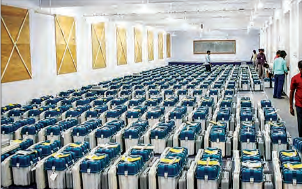
जन एक्सप्रेस/एजेंसी। नई दिल्ली

देश में अगर लोकसभा और विधानसभाओं के चुनाव एक साथ कराए जाते हैं, तो नई इलेक्ट्रॉनिक वोटिंग मशीन (ईवीएम) की खरीद के लिए चुनाव आयोग (ईसी) को हर 15 साल में करीब दस हजार करोड़ रुपये की जरूरत होगी। देश में चुनाव कराने वाली शीर्ष संस्था ने सरकार को लिखे एक पत्र में यह बात कही।