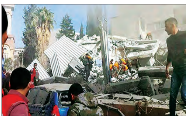
जन एक्सप्रेस/एजेंसी। दमिश्क

गाजा में हमसा के साथ जंग के अलावा इसाइल कई मोर्चों पर संघर्ष कर रहा है। एक ओर जहां हिजबुल्लाह लेबनान की ओर से उसके उत्तरी हिस्से को निशाना बना रहा है। वहीं दूसरी ओर, लाल सागर में हूती विद्रोहियों के व्यापारिक जहाजों पर हमले जारी हैं। इस बीच, इसाइली बलों ने सीरिया में एक इमारत पर हमला किया है। इस इमारत में कथित