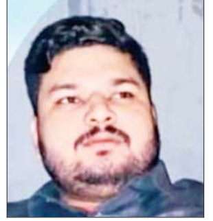
जन एक्सप्रेस फॉलो अप कानपुर नगर