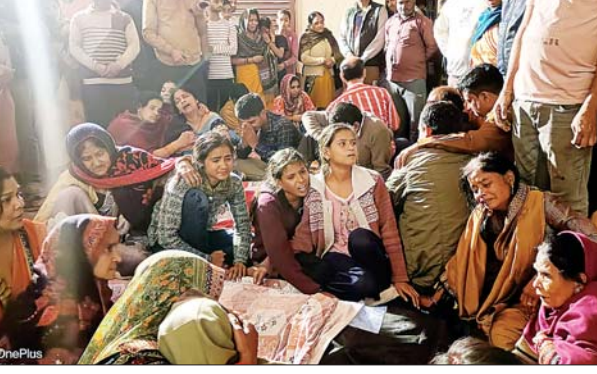
जन एक्सप्रेस। कमलेश फाउंडर/हिमांशु मिश्र

अयोध्या/कानपुर नगर। शहर के थाना बरौं क्षेत्र स्थित वर्ल्ड बैंक कॉलोनी निवासी आधा दर्जन युवक बीते शनिवार को प्रभु श्री राम की नगरी अयोध्या में उनके बाल रूप के दर्शन करने गए हुए थे। रविवार को सभी युवक रामलला के दर्शन करने से पहले सरयू नदी के शमशान घाट पर स्नान रहे थे इसी दौरान एक युवक गहरे पानी में जाकर डूबने लगा उसे बचाने के लिए बाकी के पांच साथी भी पानी में आगे बढ़े और डूबने लगे, सरयू नदी में बहकर तीन परिवारों को रोशन करने वाले चिराग डूब कर बुझ गए, तीन युवकों की जान अयोध्या जल पुलिस ने किसी तरह से बचाई है, जैसे ही डूबे युवकों के परिजनों को कानपुर में सूचना हुई उनके घरों