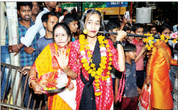
जन एक्सप्रेस | कानपुर नगर

मंगलवार को चैत्र नवरात्र की अष्टमी के दिन शहर में माता रानी के भक्तों ने माता महागौरी का पूजन करने के बाद जगह-जगह से माता रानी के विशाल जवारों निकाले। जिधर देखो उधर माता रानी की भक्ति और शक्ति का अनोखा संगम देखने को मिल रहा था। 5 साल के बच्चों से लेकर के 60 से 70 साल के बुजुर्ग महिलाएं एवं पुरुष जवारों में नंगे पैर दिखे और साथ ही साथ उनके मुंह से आर पार सांगे दिखाई दी। जिन सांगों को भक्तों ने अपने मुंह से आर पार करवा रखा था उनके वजन के बारे में