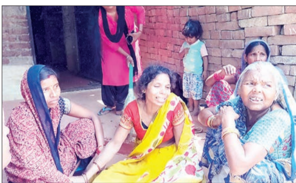
अब जिम्मेदार पीट रहे लकीर