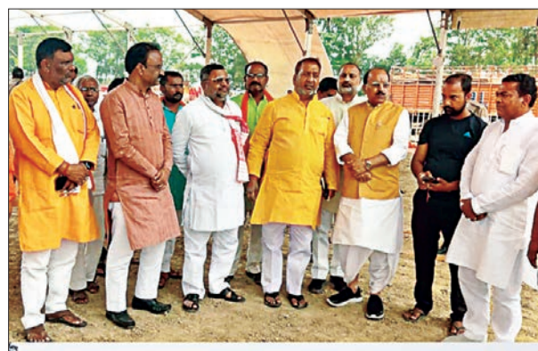
अव्यवस्था ना हो। बताते चलें कि पीएम मोदी बांसगांव लोकसभा क्षेत्र

व्यवस्था करने का निर्देश दिया। पीएम मोदी की रैली के प्रभारी हरीश ठाकुर ने सभी कार्यकर्ताओं से आग्रह किया की अनुशासित रूप से सभी कार्यकर्ता अपने-अपने दायित्वों का निर्वहन करें तथा इस बात का विशेष ध्यान रखें की आने वाली जनता को पानी की समस्या के लिए जूझना ना पड़े और किसी भी प्रकार की