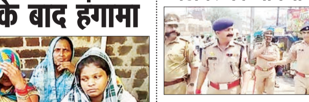
जन एक्सप्रेस | कानपुर नगर

शहर में चारो ओर अतिक्रमण हटाओ अभियान चलाया जा रहा है। जिससे की जनता को जाम से छुटकारा दिलाया जा सके। डीसीपी पूर्वी, एसीपी कलकटरगंज ने कई थानों के फोर्स के साथ कई क्षेत्र में पैदल गस्त कर अतिक्रमण हटवाया और जो लोग हटाने के बाद भी अतिक्रमण हटाने को तैयार नहीं थे उनका सामान थाने भिजवा दिया। घंटाघर, कलकटरगंज, बादशाहीनाका, एक्सप्रेस रोड सड़कों पर अतिक्रमण करके लोग दुकान सजाये बैठे रहते हैं जो की जाम का विशेष कारण है। लगातार आलाधिकारियों द्वारा ट्रैफिक नियंत्रण को सुव्यवस्थित करने के लिए कई बेहतर प्रयास किये जा रहे मगर अतिक्रमण में हटाने पर पानी फेर देता जिसके बाद शहर के आलाधिकारी अब अतिक्रमण हटाओ अभियान चला रहे हैं जिससे शहरवासियों को एक अच्छे ट्रैफिक व्यवस्था मिले।