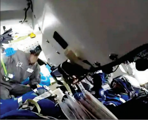
जन एक्सप्रेस/एजेसी। फ्लोरिडा

बोइंग के स्टारलाइनर स्पेसक्राफ्ट ने उड़ान भरी, पहले दो बार टल गई थी