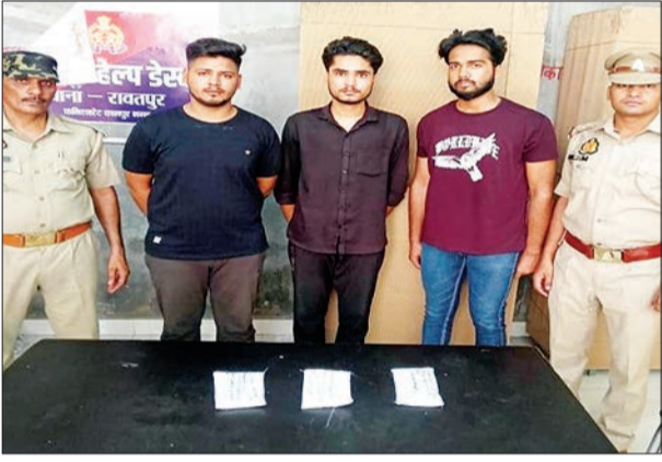
जन एक्सप्रेस | कानपुर नगर

थाना रावतपुर पुलिस ने तीन शातिर युवकों को गिरफ्तार करने में सफलता हासिल की है। गिरफ्तार किए गए तीनों युवकों के द्वारा एक विवाहिता से उसके निजी फोटो और वीडियो को वायरल करने की धमकी देकर ब्लैकमेल किया जा रहा था। और वायरल ना करने की आवाज में उससे 50000 की डिमांड की जा रही थी। रावतपुर कोतवाल और उनकी पुलिस