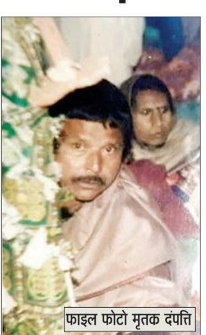
फाइल फोटो मृतक दंपति

अभी हाल ही में थाना काकादेव क्षेत्र में बीते दिनों दो बुजुर्ग महिलाओं का शव किचन में पड़ा मिला था और कल थाना चमनगंज के श्रीनगर प्लाट नंबर पांच पर एक दंपति बुजुर्ग का शव किचन में पड़ा मिला है पुलिस घटना की जांच पड़ताल कर रही है।