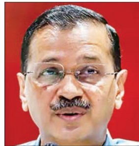
नई दिल्ली

दिल्ली शराब नीति से जुड़े भ्रष्टाचार मामले में राज जेजे कोर्ट ने बुधवार (5 मई) को अरविंद केजरीवाल की जूरीशियल कस्टडी 19 जून तक बढ़ दी। केजरीवाल को कोर्ट में वीडियो कॉन्फ्रेंसिंग के जरिए पेश किया गया। कोर्ट ने केजरीवाल की मेडिकल ग्रांड पर 7 दिन की जमानत की मांग वाली अंतरिम जमानत याचिका को खारिज