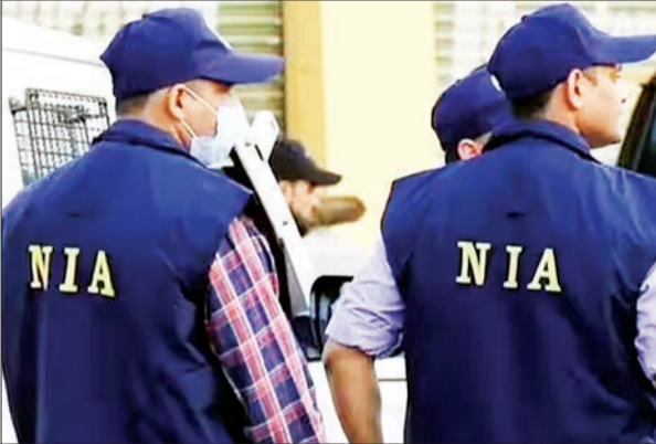
जन एक्सप्रेस/एजेसी। बेंगलुरु

असम में बुधवार को बाढ़ से पीड़ित लोगों की स्थिति में सुधार हुआ है। मंगलवार तक नौ जिलों में जहां पीड़ितों की संख्या 4.23 लाख थी, वहीं अब यह संख्या घटकर आठ जिलों में 2.5 लाख रह गई है। हालांकि, राहत के बीच डूबने से एक और व्यक्ति की जान चली गई। इसके साथ ही इस साल बाढ़, भूस्खलन और तूफान में जान गंवाने वाले लोगों की कुल संख्या 34 हो गई है। असम राज्य आपदा प्रबंधन प्राधिकरण (एसडीएमए) की दैनिक बाढ़ रिपोर्ट के अनुसार, कछर जिले के कटिंगोरा राजस्व सर्कल में एक व्यक्ति की मौत हो गई। इसके अलावा कछर, दिमा हसाओ, हैलाकांडी, होजाई, पश्चिम कार्बाँ आंगलोग, करीमगंज, मोरीगांव और नागाव जिलों में बाढ़ के कारण लगभग 2,47,000 लोग प्रभावित हुए। एसडीएमए के अनुसार, 1.4 लाख से अधिक लोगों के साथ नागाव सबसे बुरी तरह प्रभावित है, इसके