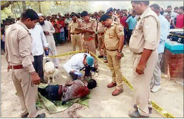
जन एक्सप्रेस | कानपुर नगर/उन्नाव

शहर के थाना अनवरगंज क्षेत्र स्थित इफितखारा बाद के बैंक ऑफ बड़ौदा वाली गली में निवास करने वाला एक कपड़ा कारोबारी युवक बीती चार जून को अपने घर से यह कह कर निकला कि वह दोस्त के साथ ढाबे में खाना खाने जा रहा है लेकिन वह वापस नहीं आया। पूरी रात्रि घर वालों ने रिश्तेदारों के संपर्क मिलकर उसकी खोजबीनी की तो उसका कहीं अता-पता नहीं चला मोबाइल फोन भी उसका स्विच ऑफ जा रहा था। परिजन जब थक हार गए तो रात्रि में अपने घर चले गए और यह तथ्य हुआ कि सुबह युवक को ढूँढ जाएगा पुलिस में शिकायत की जाएगी लेकिन जैसे ही सुबह हुई जनपद उन्नाव के थाना अजगैन पुलिस का