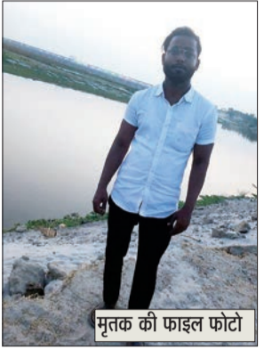
मृतक की फाइल फोटो

शहर के थाना अनवरगंज क्षेत्र स्थित इफितखारा बाद के बैंक ऑफ बड़ौदा वाली गली में निवास करने वाला एक कपड़ा कारोबारी युवक बीती चार जून को अपने घर से यह कह कर निकला कि वह दोस्त के साथ ढाबे में खाना खाने जा रहा है लेकिन वह वापस नहीं आया। पूरी रात्रि घर वालों ने रिश्तेदारों के संपर्क मिलकर उसकी खोजबीनी की तो उसका कहीं अता-पता नहीं चला मोबाइल फोन भी उसका स्विच ऑफ जा रहा था। परिजन जब थक हार गए तो रात्रि में अपने घर चले गए और यह तथ्य हुआ कि सुबह युवक को ढूँढ जाएगा पुलिस में शिकायत की जाएगी लेकिन जैसे ही सुबह हुई जनपद उन्नाव के थाना अजगैन पुलिस का