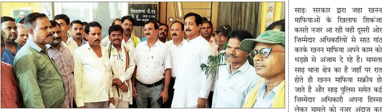
जन एक्सप्रेस | कानपुर नगर

कानपुर नगर निगम कर्मचारी संघ के एक प्रतिनिधि मंडल ने बुधवार को नगर आयुक्त शिवशरणा जी. एन. से मुलाकात की। जिसमें संघ के प्रतिनिधि मंडल द्वारा नगर आयुक्त से कर्मचारी समस्याओं का समाधान व आदेश निर्गत किए जाने संबंधी बातचीत हुई जिस पर नगर आयुक्त ने कहा कि अपर नगर आयुक्त आवेश खान चुनाव ड्यूटी से वापस आ जाए, सुबह ही समस्याओं के समाधान का