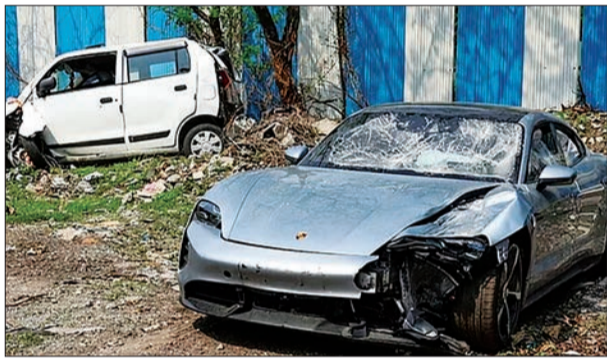
नाबालिग के दादा को भी गिरफ्तार कर चुकी पुलिस