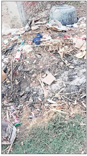
फरेंदा विकास खण्ड क्षेत्रांतर्गत ग्राम सभा कम्परिया खुर्द का टोला सेमरावाड़ी है।

भारत सरकार की बहुआयामी योजना स्वच्छ भारत अभियान के तहत शहर से लेकर गांवों तक की साफ-सफाई व्यवस्था को चुस्त दुरुस्त करने हेतु प्रति वर्ष अरबों रूपए खर्च किए जा रहे परंतु जिम्मेदारों के गैर जम्मेदाराना खर्च से शहर से लेकर गांवों तक की साफ-सफाई की व्यवस्था कागजी खानापूर्ति बनकर रह गई है जहां जिम्मेदार कागजों में स्वच्छता अभियान में गांव से लेकर नगर तक को स्वच्छता अब्बल दर्जा दिया जा रहा है और सरकार से वहांवाली लूटने का काम किया जा रहा है, जबकि धरातल पर व्यवस्था शून्य है और जिम्मेदार मालामाल है। जिसका जीता जागता उदाहरण महाराजगंज जिले के