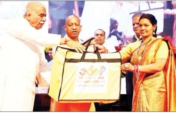
जन एक्सप्रेस | लखनऊ

मुख्यमंत्री योगी आदित्यनाथ ने कहा है कि उत्तर प्रदेश में एमएसएमई की 90 लाख से अधिक इकाइयाँ मौजूद हैं। 2017 में प्रदेश देशी की छठे नंबर की अर्थव्यवस्था थी, जो आज दूसरे स्थान पर आ गई है। यही कारण है कि रोजगार देने के मामले में यूपी आज पहले पायदान पर है। प्रदेश की अर्थव्यवस्था को आगे बढ़ाने में राज्य के एमएसएमई उद्यमियों की बहुत महत्वपूर्ण भूमिका है। सीएम योगी गुरुवार को अंतरराष्ट्रीय एमएसएमई दिवस पर लोकभवन सभागार में आयोजित कार्यक्रम को संबोधित कर रहे थे। कार्यक्रम को संबोधित करते हुए मुख्यमंत्री योगी आदित्यनाथ ने कहा