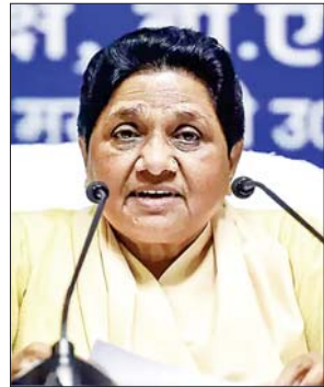
जन एक्सप्रेस | लखनऊ

आपातकाल पर बयानबाजी को नजरअंदाज किया जा सकता था- राहुल गांधी