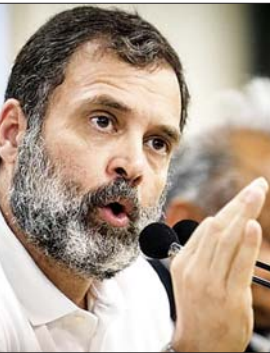
जन एक्सप्रेस | लखनऊ

राष्ट्रपति द्रौपदी मुर्मू ने 18वें लोकसभा में अपना अभिभाषण पेश किया। उनके इस अभिभाषण विपक्षी पार्टियों की प्रतिक्रिया आई है। सपा और बसपा के साथ कांग्रेस ने इस पर तीखी प्रतिक्रिया दी है। राष्ट्रपति द्रौपदी मुर्मू ने लोकसभा और राज्यसभा की संयुक्त बैठक को संबोधित किया। इस दौरान उन्होंने