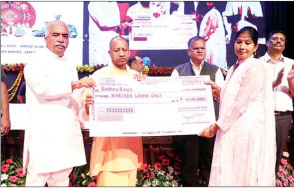
प्रदेश में 90 लाख से अधिक एमएसएमई इकाई

कि पूरी दुनिया में एमएसएमई अर्थव्यवस्था की रीढ़ होती है। यूपी सौभाग्यशाली है कि यहां सैकड़ों साल से स्थानीय स्तर पर हस्तशिल्पी, कारीगर अपने उत्पादों का निर्माण करते रहे हैं। मगर विगत दशकों में उचित प्रोत्साहन के अभाव में हमारा सूक्ष्म, लघु और मध्यम उद्यम दम तोड़ रहा था। 2017 तक एमएसएमई उद्यमियों के बीच हताशा और निराशा थी। हमारा प्रदेश अर्थव्यवस्था और रोजगार में फिसलू था। कृषि के बाद एमएसएमई ही रोजगार सृजन का सबसे बड़ा क्षेत्र है। इसे ध्यान में रखते हुए 2017 के बाद से लगातार किये गये प्रयास के फलस्वरूप आज हमारा एमएसएमई उद्योग प्रदेश के विकास की रीढ़ बन चुका है।