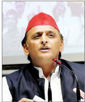
जन एक्सप्रेस | लखनऊ

राष्ट्रपति द्रौपदी मुर्मू ने 18वें लोकसभा में अपना अभिभाषण पेश किया। उनके इस अभिभाषण विपक्षी पार्टियों की प्रतिक्रिया आई है। सपा और बसपा के साथ कांग्रेस ने इस पर तीखी प्रतिक्रिया दी है। राष्ट्रपति द्रौपदी मुर्मू ने लोकसभा और राज्यसभा की संयुक्त बैठक को संबोधित किया। इस दौरान उन्होंने