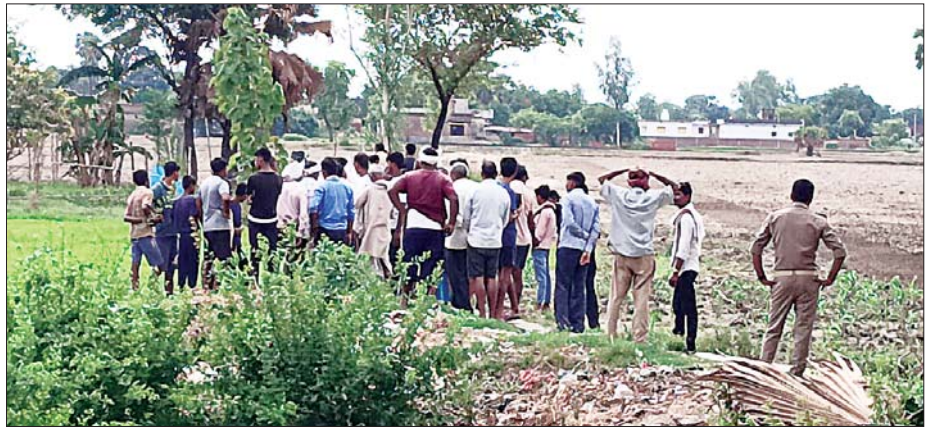
जन एक्सप्रेस। गोरखपुर