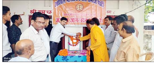
जन एक्सप्रेस | कानपुर देहात