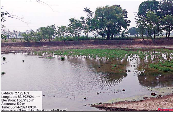
Latitude: 27.23163 Longitude: 83.69294 Elevation: 106.51 m Accuracy: 5.9 m Time: 06-14-2024 09:04

सरकार एक तरफ भ्रष्टाचार पर लगाम लगाने और जीरो टॉलरेंस की नीति पर काम करने की बात कर रही है। वहीं दूसरी तरफ जिम्मेदारों की उदासीनता से मिट्टी बल्लों अंतर्गत विभिन्न ग्राम पंचायतों में मनरेगा के तहत हो रहे विकास कार्यों में जम कर लूटखसोट व अनियमितता बरती जा रही है। ब्लॉक स्तरीय अधिकारियों द्वारा कार्य स्थल का औचक मुआयना नहीं किए जाने से रोजगार सेवक मेट बिना काम पर गए सैकड़ों श्रमिकों की फर्जी तरीके से फोटो अपलोड कर ऑनलाइन हाजिरी लगाकर सरकारी धन का बंदरबांट करने में जुटे हैं। वहीं वास्तविक श्रमिकों को काम मिलना मुश्किल हो रहा है। ऐसा ही एक मामला मिटौरा विकासखंड अंतर्गत ग्राम पंचायत बरवा सोनिया का प्रकाश में आया है। जहां पोखरी खुदाई/जीर्णोद्धार कार्य में बिना कार्य