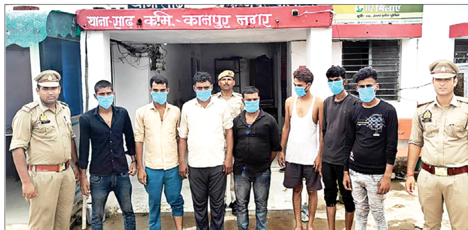
जन एक्सप्रेस | कानपुर नगर

साढ़ पुलिस को मिली सूचना पर पुलिस ने तत्काल छापा मार कर सात जुआरियों को मौके से गिरफ्तार कर लिया। सारा मामला बीते शनिवार का है जब साढ़ पुलिस को मुखबिर के द्वारा सूचित किया गया कि भीतरगांव के तिवारीपुर चौराहे के पास