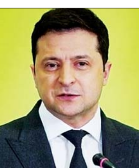
जिसका दुनिया के अधिकतर देशों द्वारा समर्थन किया जाएगा।

यूक्रेनी राष्ट्रपति ने स्लोवेनियाई राष्ट्रपति नताशा पिर्क मुसर के साथ कीव में एक संवाददाता सम्मेलन में कहा, हमारे लिए यह बहुत महत्वपूर्ण है कि हम युद्ध को समाप्त करने के लिए एक ऐसी योजना पेश करें,