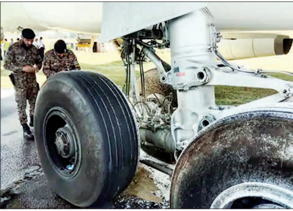
जन एक्सप्रेस/एजेंसी। नई दिल्ली

सऊदी एयरलाइंस की फ्लाइट में पाकिस्तान के पेशावर एयरपोर्ट पर गुरुवार को आग लग गई। इसमें 10 लोग जखमी हो गए। हादसा तब हुआ जब विमान लैंड कर रहा था। यात्रियों और कब्रिन क्यू के सभी सदस्यों को इमरजेंसी गेट से बाहर निकाला गया। फ्लाइट रियाद से पेशावर आई थी।