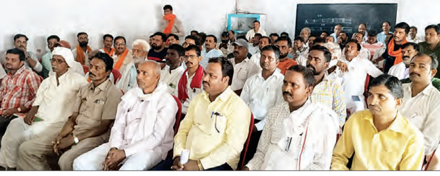
जन एक्सप्रेस | निवासन खीरी

भारतीय जनता पार्टी द्वारा कार्यकर्ताओं की बैठक नगर के सरस्वती शिशु मंदिर में सम्पन्न हुई। कार्यक्रम में पहुंचे मुख्य अतिथि पूर्व केंद्रीय गृह राज्यमंत्री मा0 अजय मिश्र टैनी पहुंच कर कार्यकर्ताओं का हौसला अफजाई करते हुए कहा कि कार्यकर्ता ही सर्वोपरि है कार्यकर्ता ही पार्टी की रीढ़ है। और बताया कि 2027 में पुनः भारतीय जनता पार्टी की सरकार बनाने के लिए सभी कार्यकर्ता