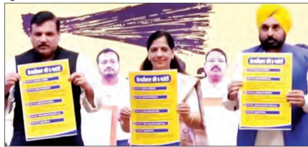
नई दिल्ली

आम आदमी पार्टी ने शनिवार को हरियाणा विधानसभा चुनाव के लिए पांच गारंटी जारी की। इसके लिए अरविंद केजरीवाल की पत्नी सुनीता केजरीवाल शनिवार को पंचकूला पहुंचीं। पार्टी हरियाणा विधानसभा की 90 सीटों पर चुनाव लड़ने के लिए जोर-शोर से तैयारियों में जुटी है। इस मौके पर पंचाब के सीएम भगवंत मान, राज्यसभा सदस्य संजय सिंह और डॉ. संदीप पाठक भी मौजूद रहे। पंचाब विधानसभा चुनाव की तर्ज पर पार्टी ने हरियाणा में गारंटी लॉन्च की। पहली गारंटी की घोषणा पार्टी ने मुफ्त