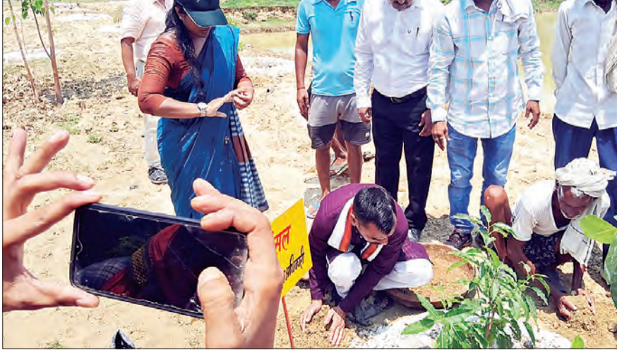
लिए प्रोत्साहित किया है। एक पेड़ मां के नाम लगाने की देश वासियों से अपील की है। प्रधानमंत्री के पदचिन्हों