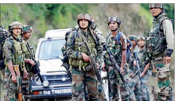
जन एक्सप्रेस/एजेसी। श्रीनगर

कुपवाड़ा जिले के केरन सेक्टर में गुफवार को मारे गए दो विदेशी आतंकियों से ऑस्ट्रिया निर्मित बुलपप अर्सांल्ट राइफल, स्टेयर एयूजी बरामद की गई है। इस तरह की राइफलों का प्रयोग अफगानिस्तान में नाटो देश की सेनाओं द्वारा किया जाता था। आधिकारिक सूत्रों ने इसे दुर्लभ बरामदगी बताया है। लाइन