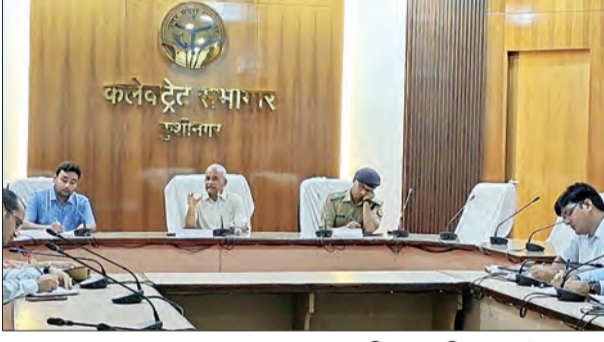
राज्य सूचना आयुक्त ने की समीक्षा बैठक

ने बताया कि अन्य बलों के अलावा, इस राइफल का इस्तेमाल अफगानिस्तान में नाटो बलों द्वारा किया गया है, इसलिए संभवतः यह वहां से पाकिस्तान पहुंची होगी। सेना के एक प्रवक्ता ने शुक्रवार को कहा, गुफवार को केरन सेक्टर में एलओसी पार से आतंकी चुसपेट की कोशिश को सुरक्षाबलों ने नाकाम कर दिया था। भीषण गोलीबारी में दो विदेशी आतंकी मारे गए थे। इनके पास से हथियारों के जखीरे के अलावा एक पाकिस्तानी पहचान पत्र भी बरामद हुआ था। कहा, पिछले कुछ हफ्तों में एलओसी पर यह तीसरा सफल चुसपेट विरोधी अभियान था।