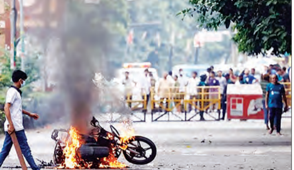
जन एक्सप्रेस/एजेसी। नई दिल्ली

पड़ोसी देश बांग्लादेश इन दिनों हिंसा की आग में झुलस रहा है। सरकारी नौकरियों में आरक्षण के मुद्दे शुरू हुआ विरोध प्रदर्शन देशभर में उग्र रूप ले चुका है। हिंसा प्रभावित देश से लोग पलायन कर रहे हैं। इस बीच, भारत के विदेश मंत्रालय ने बताया कि अब तक सैकड़ों भारतीय छात्र अलग-अलग मार्गों के जरिए वापस देश लौट आए हैं।