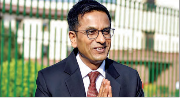
मद्रुटे

मद्रास उच्च न्यायालय की मद्रुटे पीठ की स्थापना को 20 साल पूरे हो गए हैं। इसी मौके पर मुख्य न्यायाधीश (सीजेआई) डीवाई चंद्रचूड़ ने एक समारोह का उद्घाटन किया। साथ ही उन्होंने शुक्रवार को माइक्रोसॉफ्ट के कंप्यूटर सॉफ्टवेयर के अपडेट में आई तकनीकी खामियों के कारण दुनियाभर में मचो उथल-पुथल पर भी बात की।