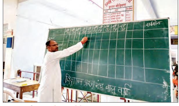
जन एक्सप्रेस | लखीमपुर खीरी