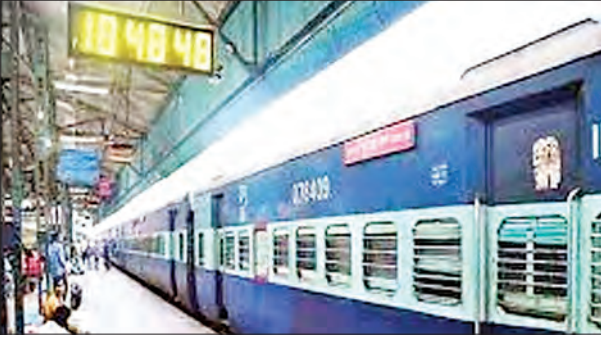
जन एक्सप्रेस | उज्जाव

जैतीपुर रेलवे स्टेशन की डाउन लूप लाइन पर छह से 14 अगस्त तक नॉन इंटरलाकिंग काम होने से रेलवे ने सात दिन के लिए कानपुर-लखनऊ रेल मार्ग की आठ ट्रेनों को निरस्त किया है। आठ ट्रेनों का रूट बदला है और 20 के समय में बदलाव किया है। मिशन रफ्तार के तहत ट्रेनों की रफ्तार बढ़ाने पर काम कर रहा रेलवे दो साल से लखनऊ-कानपुर रेल मार्ग का सुधार कार्य करा रहा है। जैतीपुर स्टेशन पर डाउन लूप लाइन पर नॉन इंटरलाकिंग का काम होना है। इससे वीरगंगा लक्ष्मीबाई ट्रेन तीन दिन और कासगंज-लखनऊ स्पेशल दो दिन के लिए निरस्त रहेगी। इसके अलावा रेलवे ने अलग-अलग दिनों में कुल आठ ट्रेनों के रूट में बदलाव किया है।