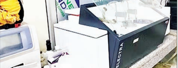
जन एक्सप्रेस | उन्नाव

जिला अस्पताल में लिवर और किडनी की जांच करने वाली मशीन ने जवाब दे दिया है। छह दिन से जांचें बंद होने से सीएमएस ने शासन को पत्र भेजकर नई मशीन की मांग की है। जिला अस्पताल की लैब में मरीजों की किडनी, लिवर और लिपिड प्रोफाइल (खून में कोलेस्ट्रॉल की जांच) के लिए सेलेक्ट्रॉन मशीन लगी है। मशीन काफी पुरानी होने से आए दिन खराबी आ जाती है। जांच के लिए सैपल लगाने के कुछ देर बाद ही मशीन से आवाज आती है और