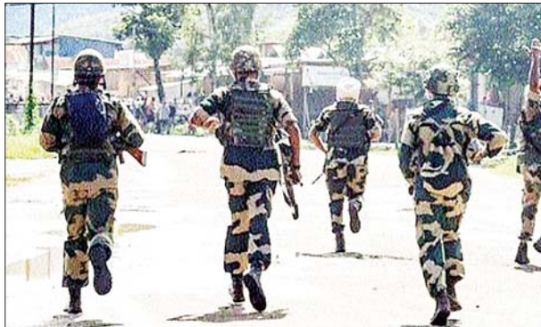
जन एक्सप्रेस/एजेंसी। इंग्लैंड

मणिपुर में पिछले साल से शुरू हुई हिंसा थमने का नाम ही नहीं ले रही है। तीन मई 2023 के बाद से लेकर अब तक हिंसा की अनेक वारदात हो चुकी हैं। कभी सुरक्षा बलों के हथियार लुटे जा रहे हैं तो कभी उनका रास्ता रोका जा रहा है। यहां तक कि अब ड्रोन और बम भी हमले