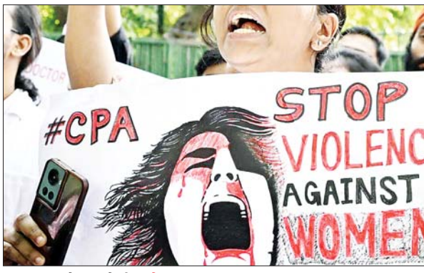
कोलकाता

कोलकाता के आरजी कर मेडिकल कॉलेज में जूनियर डॉक्टर की हत्या के विरोध में प्रदर्शन कर रहे डॉक्टरों ने अब राष्ट्रपति द्रौपदी मुर्मू और प्रधानमंत्री नरेंद्र मोदी को पत्र लिखा है। डॉक्टरों ने पत्र में आरजी कर मामले में मृत चिकित्सक और अन्य चिकित्सकों को न्याय दिलाने के लिए हस्तक्षेप करने की मांग की है। डॉक्टरों ने पत्र में लिखा है कि हम देश के प्रमुख के तौर पर आपके समक्ष मुद्दा रखते हैं। हम चाहते हैं कि हमारे जो सहयोगी अपराध का शिकार हुए हैं, उनको न्याय मिले। आपके हस्तक्षेप के बाद ही पश्चिम बंगाल स्वास्थ्य विभाग के तहत स्वास्थ्य देखभाल पेशेवर भय और