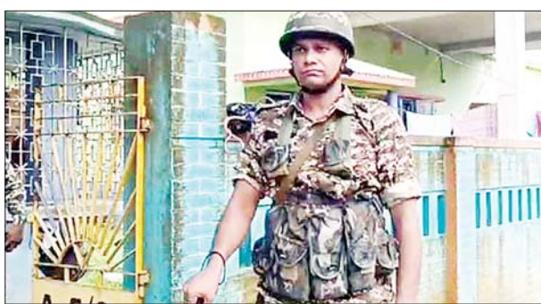
नई दिल्ली