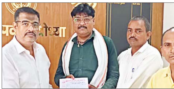
ब्लाक स्तर पर महीने के 22 तारीख को बैठक व जिला मुख्यालय पर 28 तारीख को बैठक पूर्व की भांति की जाय। अग्र निदेशक पंचायती राज के स्पष्ट आदेश के बावजूद सफाई कर्मचारियों को रोड पर सांड पकड़वाने के लिए ड्यूटी न लगाया जाय। उत्तर प्रदेश पंचायती राजग्रामीण सफाई कर्मचारियों की वार्षिक चरित्र प्रविष्टि कई वर्षों से जिला मुख्यालय पर नहीं भेजा गया है। जबकि जिला पंचायत राजअधिकारी का स्पष्ट आदेश है वार्षिक चरित्र प्रविष्टि जिला मुख्यालय पर भेजा जाय। उत्तर प्रदेश पंचायती राज ग्रामीण सफाई कर्मचारियों की ड्यूटी लगायी जाती है तो ग्राम प्रधान को अवगत कराया जाय जिससे पैराल जैसी समस्या का निराकरण हो। उत्तर प्रदेश पंचायती राज ग्रामीण सफाई कर्मचारियों की जेष्ठता व वरिष्ठता सूची बनायी जाय।