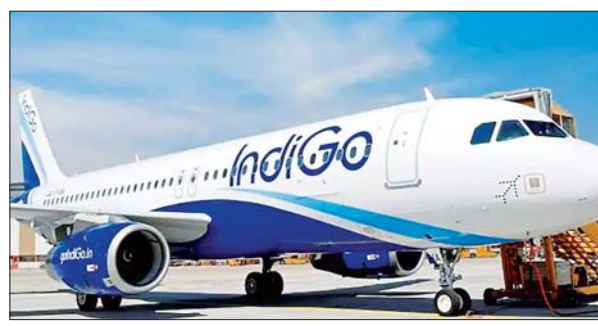
जन एक्सप्रेस/एजेंसी। नई दिल्ली

शुक्रवार को खराब मौसम के कारण इंडिगो की मुंबई से फुकेट जाने वाली फ्लाइट को मलेशिया के पेनांग की ओर डायवर्ट करना पड़ा। कुछ लोगों ने सोशल मीडिया पर इसकी जानकारी दी है। इंडिगो ने एक बयान में कहा, फुकेट में खराब मौसम की स्थिति के कारण मुंबई से फुकेट जाने वाली उड़ान 6ई 1701 को मलेशिया के पेनांग की ओर मोड़ दिया गया है, जो सबसे नजदीकी हवाई अड्डा है। एयरलाइन ने यह भी कहा कि फुकेट (थाईलैंड में) के लिए उड़ान भरने की आवश्यक अनुमति प्राप्त करने की प्रक्रिया चल रही है, लेकिन इसमें कुछ समय लग सकता है। बयान में कहा गया है, यात्रियों को इस डायवर्जन के बारे में पूरी जानकारी दे दी गई है। इस बीच, उनकी सुविधा सुनिश्चित करने के लिए जलपान की व्यवस्था की गई है। विमान में सवार यात्रियों की संख्या के बारे में तुरंत जानकारी नहीं दी गई है। फ्लाइट ट्रेकिंग वेबसाइट फ्लाइट राइडर 24 पर उल्लेख जानकारी के अनुसार, यह उड़ान ए320 विमान से संचालित की जा रही थी। इंडिगो ने कहा कि, यात्रियों की सुरक्षा सुनिश्चित करने के लिए आवश्यक एहतियात के तौर पर इस डायवर्जन को किया गया।