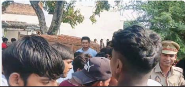
मालिक से तीनों बाइक को छत्रपूर्ती सुलह समझौते की बात करमा चौकी पर किया जा रहा है।

बाल-बाल बचे राहगीर और ट्रैक्टर चालक ने गम्भीर रूप से घायल हो गया। वही ग्रामीणों के मदद से ट्रैक्टर चालक को नजदीकी अस्पताल में इलाज के लिए भर्ती कराया गया। घटना की सूचना पर पहुंची स्थानीय पुलिस ने ट्रैक्टर वाहन स्वामी को बुलाकर कार्रवाई की बात कहते हुए ट्रैक्टर को चौकी पर ले जाया गया?। क्षेत्रीय नेताओं ने ट्रैक्टर सड़क पर गिर गया।