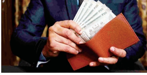
जन एक्सप्रेस | कानपुर नगर

महीने के आखिरी दिन पड़ रहे दीपावली के त्योहार से पहले की तैयारियों को लेकर चिंता में डूबे कर्मचारियों के लिए राहत भरी खबर है। नगर निगम, जलकल और कानपुर विकास प्राधिकरण ने अपने कर्मचारियों को धनतेरस से पहले वेतन देने के लिए तैयारी शुरू कर दी है। सभी प्रभारी अधिकारियों से कर्मचारियों की हाजिरी का पूरा डेटा मांगा गया है, ताकि 25 से 27 तारीख के बीच नियमित कर्मचारियों के अलावा आउटसोर्स, पीआरडी व सुरक्षा में लगे जवानों समेत सभी श्रेणी के कर्मचारियों को वेतन दिया जा सके। इसी के साथ ही अमूमन महीने की आखिरी तारीख को वेतन पाने वाले विभिन्न विभागों के राज्य कर्मचारियों को भी धनतेरस से पहले वेतन खाते में आने की उम्मीद है। हालांकि कर्मचारी सैलरी एडवांस के साथ-