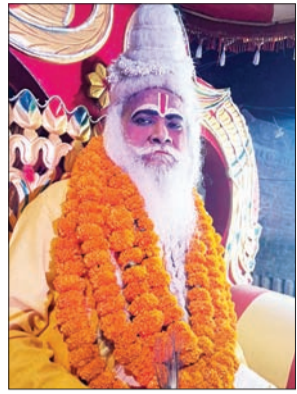
जन एक्सप्रेस | पीलीभीत

विगत दिवस देर रात महर्षि वाल्मीकि जयंती के अवसर पर जनपद के मोहल्ला नखासा वाल्मीकि मंदिर में धूमधाम एवं उत्साह पूर्वक के साथ वाल्मीकि जयंती मनाई गई साथी शोभायात्रा निकल गई जिसमें हजारों की संख्या में लोग मौजूद रहे। इसी अवसर पर जनपद के बीसलपुर तहसील क्षेत्र में महर्षि वाल्मीकि जयंती के अवसर पर कई कार्यक्रम हुए। शिक्षण संस्थानों में महर्षि वाल्मीकि जयंती धूमधाम से मनाई गई तथा वाल्मिक समाज के लोगों द्वारा नगर में शोभा यात्रा निकाली गई। महर्षि वाल्मीकि की जयंती उत्साह