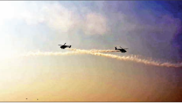
जन एक्सप्रेस | कानपुर नगर

तमिलनाडु के कोयंबटूर के पास सुलूर वायु सेना स्टेशन पर स्थित सारंग टीम, एक अद्वितीय पांच-हेलीकॉप्टर डिस्प्ले टीम है जो संशोधित एचएएल ध्रुव हेलीकॉप्टर संचालित करती है। दुनिया भर में 386 से अधिक स्थानों पर 1200 से अधिक प्रदर्शनों के साथ, सारंग टीम ने खुद को विमानन उत्कृष्टता के वैश्विक प्रतीक के रूप में स्थापित किया है। टीम द्वारा उड़ान