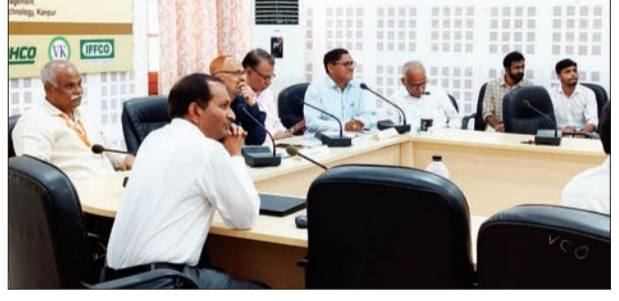
जन एक्सप्रेस | कानपुर नगर

चंद्रशेखर आजाद कृषि एवं प्रौद्योगिकी विश्वविद्यालय कानपुर एवं मृदा संरक्षण सोसाइटी ऑफ इंडिया नई दिल्ली के संयुक्त तत्वाधान में चल रही तीन दिवसीय राष्ट्रीय संगोष्ठी मृदा जल एवं ऊर्जा प्रबंधन द्वारा सतत कृषि और आजीविका सुरक्षा- विषय पर संगोष्ठी के दूसरे दिन छह तकनीकी सत्रों में कृषि वैज्ञानिकों द्वारा विभिन्न विषयों पर अपने शोध पत्र प्रस्तुत किए। जिनमें मुख्यतः ऊर्जा, पानी एवं मृदा के बचाव पर मंथन हुआ। आज इस अवसर पर मृदा एवं जल संरक्षण समिति नई दिल्ली की आमसभा भी आयोजित की गई। जिसमें संस्था की सम्मानित सदस्यों ने बढकर भाग