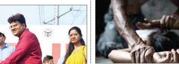
जन एक्सप्रेस | गोला गोकर्णनाथ खीरी

नगर की एक महिला दबंग से छुटकारा पाने के लिए पिछले दो सालों से पुलिस के चक्कर लगा रही है, पर कोई सुनवाई नहीं हो रही है जिससे महिला बहुत परेशान है। शनिवार को पुलिस अधीक्षक के समक्ष पेश होकर न्याय की गुहार लगाई है महिला का आरोप है कि दबंग अक्सर उसके घर घुसकर उससे छेड़छाड़ शुरू कर देता है जिससे वह आंजिज आ चुकी है। विरोध करने पर उसे मारता पीटता है। 15 अक्टूबर 2022 की है। उसका पति घर नहीं थावह घर पर थी तभी तबंगों ने उसके पति को जान से मारने की धमकी देते हुए उसका दरवाजा खुलवा लिया और फिर तमचा दिखा कर उससे छेड़छाड़ कर दुखार की कोशिश की।महिला का