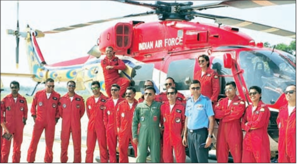
जन एक्सप्रेस | कानपुर नगर

जब भारतीय वायु सेना की प्रसिद्ध सारंग एरोबेटिक डिस्प्ले टीम ने भारतीय वायु सेना की 92वें वर्षगांठ मनाने के लिए स्टेशन के मंच पर कदम रखा तो कानपुर का आसमान रंग और उत्साह से भर गया। आम जनता सहित हजारों दर्शकों को लुभावने हवाई दृश्यों, करतबों का