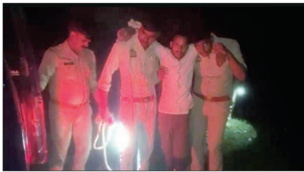
जन एक्सप्रेस | सुनहरा