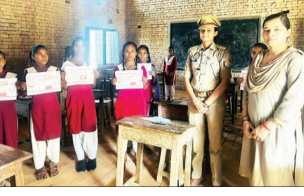
जन एक्सप्रेस | कानपुर नगर

बिल्हौर तहसील क्षेत्र के थाना अरौल द्वारा मिशन शक्ति अभियान के तहत थाना क्षेत्रांतर्गत कस्बा ज्ञान भारती कन्या विद्यापीठ इंटर कॉलेज में महिलाओं/ बालिकाओं को किया जा रहा जागरूक नारी सुरक्षा, नारी स्वावलंबन के विषय में महिलाओं/बालिकाओं को हेल्पलाइन नंबर 1090, 1076, 1098, 112, 181 आदि नंबरों की जानकारी दी गई तथा सख्तकॉप से प्राप्त होने वाली जन सुविधाओं एवं सोशल मीडिया प्लेटफॉर्म (व्हाट्सएप, ट्विटर, फेसबुक, इन्स्टाग्राम आदि) एवं