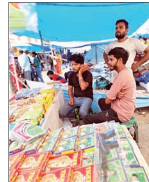
जन एक्सप्रेस | कानपुर नगर

बिल्हौर तहसील क्षेत्र में अवैध पटाखा की दुकानें हर कस्बे में भीड़भाड़ इलाकों में सज रही हैं अवैध पटाखा माफिया अपनी जान की परवाह किए हैं जिसके चलते खुद तो दुकान पर बैठता नहीं है इस समय महिलाएं, बच्चे और बुजुर्ग बैटकर दुकानों पर बेच रहे हैं हर घंटे में उसका एक आदमी बाजार में जाता है जो बिक्री होती वह पैसा लेकर चला जाता था जो माल की मांग होती है वह वहां तक माल पहुंचा देता है इस सारे कारनामे को रिहायसी इलाकों में विस्फोटक बेच रहे हैं हालांकि अभी पुलिस अधिकारियों को इसकी जानकारी नहीं शनिवार को सोशल मीडिया पर फोटो वायरल होने पर अधिकारियों ने पुलिस बल भेज कर वहां पर दिखाया पहुंचते ही वहां पर महिलाएं उन्ही दुकानों पर खिलौने बेचने लगीं हैं जहां पर पटाखे बेच रही थी उनको उखर वर झेलने में रख लिए और पटाखे की जगह खिलौने रखकर बेचने लगीं बाजार का पटाखा माफिया का युग अंकिंत सभी को गाड़लाइन एक दुकान खुद लगाकर बैटकर करता रहता है की कब कौन आदमी आ रहा है कब