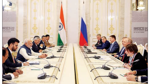
जन एक्सप्रेस/एजेंसी। नॉटको

कजान में 16वें ब्रिक्स शिखर सम्मेलन में शामिल होने पहुंचे प्रधानमंत्री नरेंद्र मोदी ने रूसी राष्ट्रपति व्लादिमीर पुतिन से मुलाकात की। इस दौरान उन्होंने रूस-यूक्रेन युद्ध को लेकर बात की। पीएम मोदी ने कहा कि रूस के साथ हमारे ऐतिहासिक संबंध हैं। हमारी गहरी मित्रता है। हमारे संबंध और मजबूत होंगे। पीएम मोदी ने रूस के राष्ट्रपति पुतिन को हमारी बहुत अच्छी चर्चा हुई थी। हम कई बार टेलीफोन पर भी बात कर चुके हैं। कजान आने का निमंत्रण स्वीकार करने के लिए मैं आपका बहुत आभारी हूँ। उन्होंने कहा कि ब्रिक्स शिखर सम्मेलन के दौरान अन्य नेताओं के साथ मिलकर हमें कुछ बहुत महत्वपूर्ण निर्णय लेने चाहिए। उन्होंने कहा कि अंतर सरकारी आयोग की अगली बैठक 12 दिसंबर को नई दिल्ली में होने