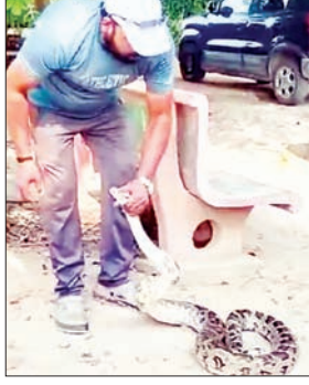
गया कि टीनशेड के नीचे पोल के सहारे कबूतरों ने घोंसला बनाया हुआ है। जिसमें उनके अंडे और बच्चे रखे हैं। इन्हें अंडों और बच्चों को निवाला बनाने के लिए अजगर लोहे के पोल के सहारे घोंसले की तरफ जा रहा था, लेकिन शिकार करने से पहले वन कर्मियों ने उसे पकड़ लिया। अजगर को डजेर शाम दूर ले जाकर जंगल में छोड़ दिया गया।

वन विभाग की पौधशाला में विशालकाय अजगर निकल आया, जिसे वहां मौजूद कर्मियों ने पकड़ लिया। ये अजगर पौधशाला के ऑफिस के बाहर पड़े टीनशेड में दिखाई दिया, जोकि कबूतर के घोंसले में बच्चों का शिकार करने की फिराक में था। विशालकाय अजगर को देखने के लिए भीड़ लग गई। गंगा रोड से रिजिंगर गांव की ओर जाने वाले रोड पर मड्डारपुर के पास वन विभाग की नर्सरी है। यहां परिसर में ही रेंज ऑफिस बना हुआ है। ऑफिस के बाहर टीनशेड लगा है, जिसके पोल में विशालकाय अजगर लिपटा हुआ नजर आया। इस अजगर को देखकर वहां भीड़ जग गई। वन कर्मियों ने पोल के सहारे सीढ़ी लगाकर किसी तरह अजगर को जमीन पर गिराया और फिर उसे पकड़ लिया। बताया