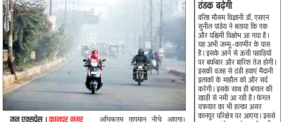
जन एक्सप्रेस | कानपुर नगर

हिमालयी क्षेत्र में हो रही बर्फबारी और बारिश का असर उत्तर-पश्चिमी हवाएं लेकर आएंगी। इससे रात का पारा और गिरेगा और ठंड बढ़ेगी। इसके साथ ही देना के तापमान में भी कमी आएगी। मौसम विज्ञानियों का कहना है कि एक तरफ तो उत्तर-पश्चिमी हवाएं ठंडक लेकर आ रही हैं और दूसरी ओर बंगाल की खाड़ी से चले फंगल चक्रवात के कारण माहौल में नमी आ रही है। इससे बादल आएंगे जिससे दिन की धूप मद्धम होगी और