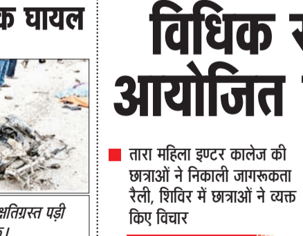
सड़क हादसे में क्षतिग्रस्त पट्टी बाइक।

आसाम रोड पर हुए सड़क हादसे में तीन लोगों की मौत हो गई। एक घायल का जिला अस्पताल बहराइच में उपचार किया जा रहा है। पुलिस ने मृतकों के शवों को पोस्टमार्टम के लिए भेज दिया है।