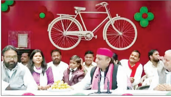
हटवाकर दूसरों पर झूठे मुकदमे लगाए हैं।