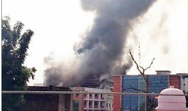
जन एक्सप्रेस | कानपुर नगर

घटना की जानकारी मिलते ही मौके पर दमकल की कई गाड़ियां पहुंच गईं और उन्होंने 2 घंटे की कड़ी में आग पर काबू पा लिया। सूत्रों मुताबिक रविवार के दोपहर कृष्ण इंस्टीट्यूट अमिलिया की चौथी मंजिल पर अचानक शॉर्ट सर्किट से आग लग गई। देखते ही देखते पूरा ऑडिटोरियम धुंकर जलने लगा। घटना में किसी भी प्रकार की जनहानी की कोई सूचना नहीं है।