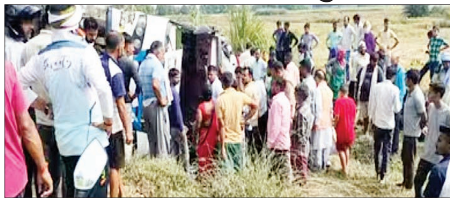
जन एक्सप्रेस | कानपुर नगर

साढ़ थाना क्षेत्र के अंतर्गत डग्गामार बस अनियंत्रित होकर खड्डे में पलट गई। इस हादसे में बस में सवार लगभग ढाई दर्जन से अधिक यात्री गंभीर रूप से घायल हो गए। घटना की सूचना पाकर पहुंची पुलिस ने घायलों को एंबुलेंस की मदद से भीतरगांव स्थित सामुदायिक स्वास्थ्य केंद्र में उतार कर लिए वहाँ कार्रवाई है। जहां पर डॉक्टरों ने प्राथमिक उपचार करने के बाद गंभीर रूप से घायल यात्रियों को कानपुर के हैलेट अस्पताल के लिए रेफर कर दिया। प्राप्त जानकारी के मुताबिक साढ़ थाना क्षेत्र के दरगाही लाल पुल पर बारा देवी चौराहे से जहानाबाद तक चलने वाली प्राइवेट बस सवारियां भरकर महेनीपुर बाय मिर्जापुर होते हुए कानपुर जा रही थी। बस जैसे ही दरगाही लाल नहर पुल के पास पहुंची