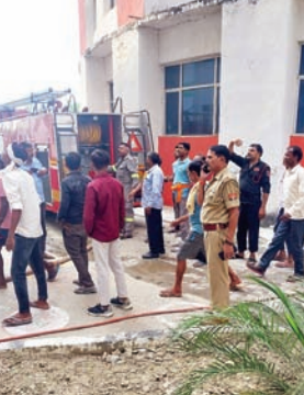
जन एक्सप्रेस | कानपुर नगर