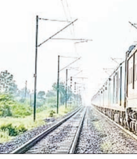
जन एक्सप्रेस | कानपुर नगर