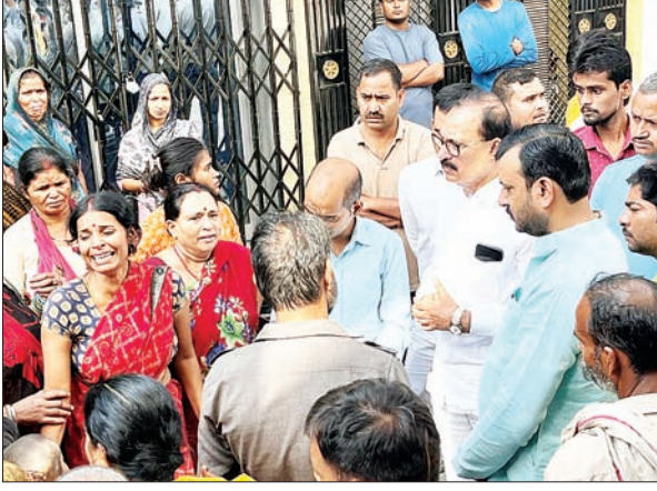
से पीड़ित परिवार की फोन पर वार्ता कराई जिस पर उप-मुख्यमंत्री ने मृतक

विधायक पोस्टमार्टम हाउस पहुंचकर परिजनों को सरकार से हर संभव मदद व न्याय दिलवाने का दिया आश्वासन