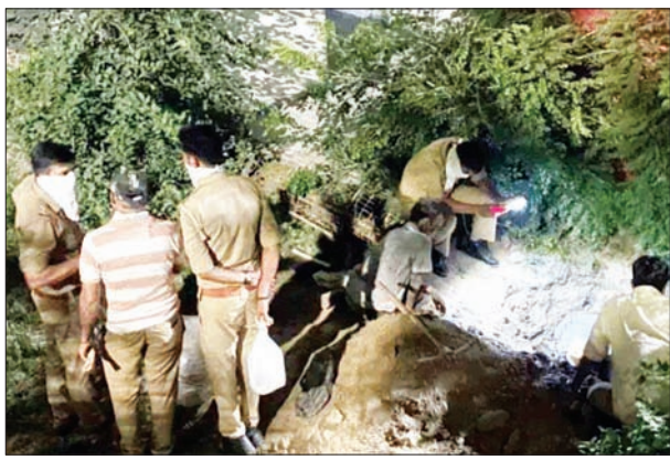
जन एक्सप्रेस | कानपुर नगर