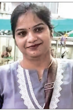
जन एक्सप्रेस | कानपुर नगर