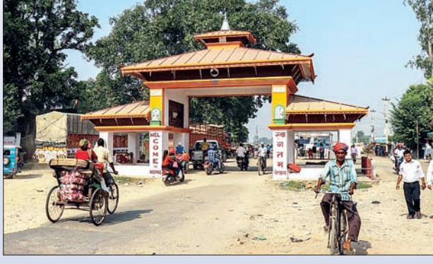
भवन निर्माण के लिए जमीनें खरीद रहे हैं। इन लोगों की आमद से सीमा क्षेत्र में

बहराइच। भारत-नेपाल सीमा क्षेत्र में मित्र राष्ट्र नेपाल के लोगों की तादाद बढ़ रही है। नगर पंचायत समेत आसपास के ग्रामीण इलाकों में नेपाल के बाशिंदे कृषि और