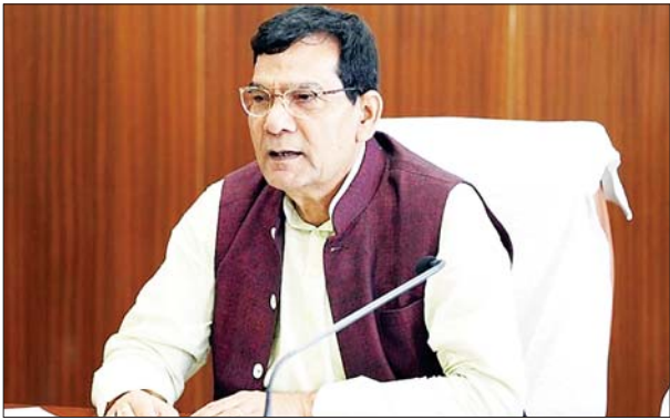
उपभोक्ताओं से हर महीने 60 रुपए अतिरिक्त वसूली जा रहे हैं।

यूपी सरकार ने बिजली की दरें नहीं बढ़ाने का फैसला किया है। नगर विकास एवं ऊर्जा मंत्री एके शर्मा ने गुरुवार को कहा कि प्रदेश में बिजली की दरें न तो महंगी हुई हैं और न ही भविष्य में महंगी होंगी। राज्य विद्युत उपभोक्ता परिषद ने टाटा पावर के उड़ीसा मॉडल पर सवाल उठते हुए कहा था कि इस मॉडल से उत्तर प्रदेश में बिजली महंगी हो सकती है। परिषद ने कहा था कि उड़ीसा में एक किलोवाट घरेलू कनेक्शन के लिए 3941 रुपए शुल्क लिया जा रहा है, जबकि उत्तर प्रदेश में यह शुल्क ग्रामीण क्षेत्रों में 1172 रुपए और शहरी क्षेत्रों में 1620 रुपए है। इसके साथ ही, उड़ीसा में स्मार्ट प्रीपेड मीटर के लिए