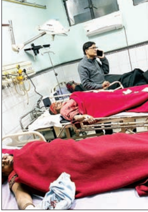
चीख पुकार मची हुई है। मामले की