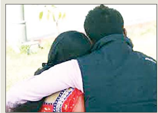
भाई दूसरे को भगा ले गया तो देवर का भाभी से शुरु हो गया प्रेम प्रसंग

जनपद के महुआडीह थाना क्षेत्रांतर्गत एक गांव में भाभी के साथ घर में रंगरेलियां मनाना देवर को पड़ा भारी। सूचना पर घर पहुंचे पत्नी के मायके वालों ने उनकी जमकर की पिटाई। मौके पर पहुंची पुलिस ने देवर और भाभी को हिरासत में लिया। महुआडीह थानाक्षेत्र के एक गांव में एक शादीशुदा देवर का अपनी भाभी के साथ पूर्व से ही प्रेम प्रसंग चल रहा था। पत्नी को इस बात की जानकारी हो गई। इसलिए पति का विरोध करने लगी, लेकिन पति अपनी हकतों से बाज नहीं आया। इसकी वजह से पति-पत्नी में विवाद होने लगा। इसी बीच देवर भाभी को लेकर कहीं फरार हो गया उसके बाद उसकी पत्नी मायके चली गई। सूत्रों के अनुसार, मायके वालों ने कुछ दिन पहले ही महुआडीह पुलिस को तहरीर देकर मामले के समाधान की फरियाद की थी, गुरुवार शाम को