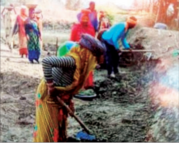
कार्य चल रहा है। ग्रामीणों ने बताया कि खुदाई कार्य जो मजदूरों द्वारा होना चाहिये वह कार्य पहले मशीनों द्वारा

भारत सरकार की सबसे महत्वपूर्ण योजना मनरेगा के नाम पर हो रहा फर्जीवाड़ा, विकास खण्ड सुमेरपुर के ग्राम पंचायत बिलहडी में तालाब खुदाई के नाम पर जमकर धांधली की जा रही है। मशीनों से खुदाई कराकर प्रतिदिन फर्जी 180 मजदूरों की डिमांड दिखाकर प्रधान व सचिव सरकारी धन का बन्दर बांट कर रहे हैं। बहुत दिनों से फोटो की फोटो अपलोड करते धांधली की जा रही है पिछले एक सप्ताह से फर्जी डिमांड लगा कर भुगतान किया जा रहा है।