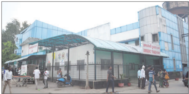
जन एक्सप्रेस। कानपुर नगर

कानपुर में हैलट अस्पताल के मनोरोग विभाग में 14 जुलाई से स्पेशल क्लीनिक शुरू हो जाएगी। व्यस्क मनोरोग ओपीडी के अलावा बाल एवं किशोर मनोचिकित्सा, नशा मुक्ति, साइको सेक्सुअल और वृद्धावस्था मानसिक स्वास्थ्य की स्पेशल क्लीनिक चलेगी। जीएसवीएम मेडिकल कॉलेज के