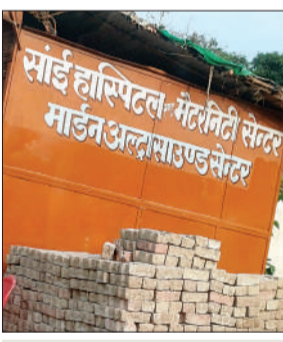
साईं हॉस्पिटल-मंडरगिरी सक्टर मंडरगिरी अल्हाबाद

कराया है, उन डॉक्टरों को इसकी जानकारी तक नहीं है! यानी डिग्री चोरी का धंधा खुलेआम फलफूल रहा है और शासन-प्रशासन मौन साधे बैठा है।