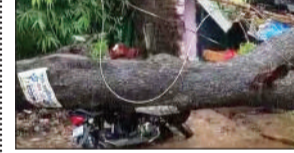
जन एक्सप्रेस। कानपुर नगर

कानपुर के नरवल कस्बे में शुक्रवार सुबह हुई तेज बारिश के चलते पीएनबी बैंक के सामने एक विशाल नीम का वृक्ष गिर गया। इस घटना में एक चाय की दुकान पर खड़ी मोटरसाइकिल पेड़ के नीचे दब गई है। साथ ही, कई बिजली के खंभे टूट गए और दुकान संचालक की झोपड़ी भी क्षतिग्रस्त हो गई है। वहीं, मुख्य मार्ग बाधित हो गया है, जिससे आवागमन पूरी तरह से बंद है। लोगों को आने-जाने के लिए काफी दिक्कत हो रही है।