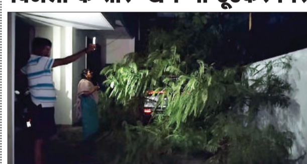
जन एक्सप्रेस। कानपुर नगर

कानपुर में सुबह से हो रही लगातार बारिश ने जनजीवन अस्त-व्यस्त कर दिया है। इसी कड़ी में, किदवाई नगर स्थित अलंकार गेस्ट हाउस के पीछे, बाई ब्लॉक में एक बड़ा हादसा हो गया। बारिश के चलते एक विशालकाय पेड़ जड़ से उखड़कर एक मकान के अंदर जा गिरा। पेड़ गिरने से केवल मकान को ही नुकसान नहीं हुआ, बल्कि इसके