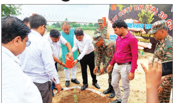
जन एक्सप्रेस। कानपुर नगर

कानपुर में नरवल तहसील के विकास खंड सरसौल के अंतर्गत नरायनपुर गांव में पर्यावरण संरक्षण की दिशा में एक महत्वपूर्ण पहल करते हुए वृक्षारोपण कार्यक्रम का आयोजन किया गया। भारतीय सेना की गंगा टास्क फोर्स और उपजिलाधिकारी