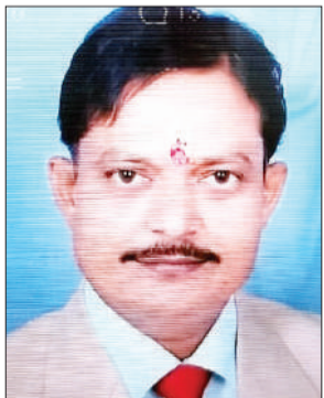
जन एक्सप्रेस। कानपुर नगर

कानपुर देहात में झांसी-कानपुर हाईवे पर भोगनीपुर थाना क्षेत्र के देवीपुर फ्लाईओवर पर गुरुवार की रात बाइक सवार प्रधानाचार्य को वाहन ने टक्कर मार दी। इससे वह गंभीर रूप से घायल हो गए। परिजन उन्हें लेकर मेडिकल कॉलेज आए, जहां डॉक्टरों ने उन्हें मृत घोषित कर दिया। प्रत्यक्षदर्शियों के मुताबिक बाइक