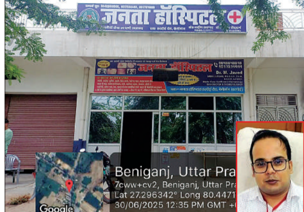
Beniganj, Uttar Pradesh