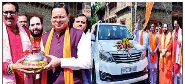
यात्रा को मुख्यमंत्री ने रवाना किया। इस दौरान महामंडलेश्वर श्री 1008 डॉक्टर स्वामी संतोषानंद देव

सीएम धामी ने शुक्रवार को मुख्यमंत्री आवास देहरादून से कुशीनगर जनपद में भगवान सूर्य की मूर्ति के जलाभिषेक के लिए कलश यात्रा का पलंग ऑफ किया। कुशीनगर में सूर्य की मूर्ति के जलाभिषेक के लिए देश से लगभग 151 पवित्र नदियों का जल एकत्र किया जा रहा है। इसी क्रम में देवभूमि उत्तराखंड की पवित्र नदियों से एकत्रित जल की कलश