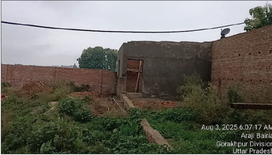
Aug 3, 2025 6:07:17 AM Arajai Bairia Gorakhpur Division Uttar Pradesh

मिली जानकारी के अनुसार, ग्राम पंचायत दूटीबारी के टोला मरचहवा में खलिहान की सरकारी भूमि पर अवैध रूप से निर्माण कार्य कराए जा रहा है। उपरोक्त निर्माण कार्य बिना किसी वैधानिक प्रक्रिया के शुरू किया गया था। ग्रामीणों द्वारा की गई शिकायत के बाद प्रशासन हरकत में आया और