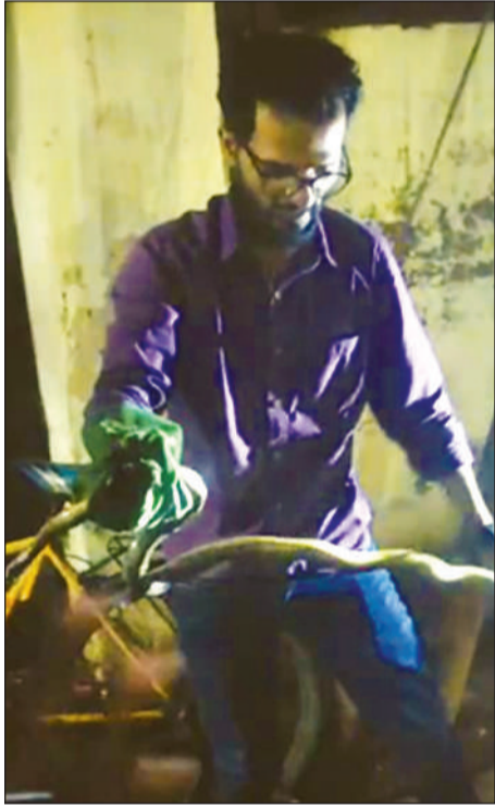
बढ़ाई। रायबरेली वन विभाग की इस कार्रवाई को एक सराहनीय कदम बताया जा रहा है।