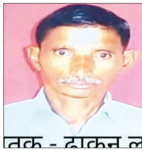
तक - टाकन ल