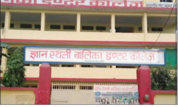
जन एक्सप्रेस। जौनपुर

जिले के सुजानगंज क्षेत्र स्थित ज्ञानस्थली इंटर कॉलेज, चैनपुर, नगौली की हाईस्कूल (2018) तथा इंटरमीडिएट विज्ञान वर्ग (2022) की मान्यता को उत्तर प्रदेश माध्यमिक शिक्षा परिषद, प्रयागराज द्वारा रद्द कर दिया गया है। यह निर्णय राज्यपाल की