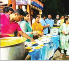
लायंस क्लब जौनपुर गोमती ने जरूरतमंदों में वितरित किया तहरी, कोतवाली चौराहे पर आयोजित हुआ भव्य कार्यक्रम