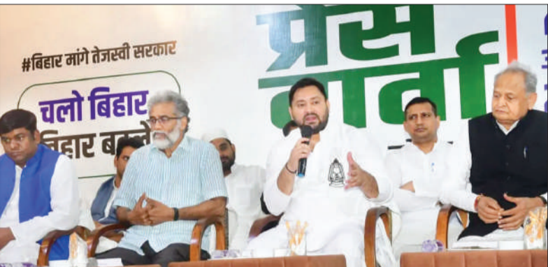
महागठबंधन की प्रेस वार्ता 50 मिनट चली, 7 दलों के 14 नेता शामिल

बिहार चुनाव के लिए महागठबंधन का सीएम चेहरा आरजेडी प्रमुख तेजस्वी यादव होंगे। कांग्रेस नेता अशोक गहलोत ने महागठबंधन की जॉइंट प्रेस वार्ता में इसका ऐलान किया। उन्होंने कहा कि अगर हमारी सरकार बनी तो उपमुख्यमंत्री मुकेश सहनी होंगे। उप मुख्यमंत्री और भी लोग बनाए जाएंगे, जो पिछड़े समुदाय से होंगे। गहलोत ने कहा कि हमारा नेता तो तेजस्वी यादव हैं। एनडीए बताए कि उनका सीएम फेस कौन होगा। सिर्फ नीतीश कुमार के नेतृत्व में चुनाव लड़ेंगे, कहने से नहीं चलेगा। ऐलान के बाद तेजस्वी यादव ने कहा कि मुझ पर फिर से भरोसा जाता है। सभी का दिल से धन्यवाद है। सबसे कहना चाहता हूँ कि जो विश्वास जाता है, उस पर खरा उतरेंगे। 20 साल पुरानी निकम्मी सरकार को उखाड़कर फेंकेंगे। महागठबंधन की जॉइंट प्रेस वार्ता 50 मिनट चली। इसमें आरजेडी, कांग्रेस, वीआईपी समेत 7 दलों के 14 नेता शामिल हुए। इसमें सभी दलों के नेताओं को बोलने मौका दिया गया। सभी ने अपनी स्पीच में महागठबंधन में एकजुटता की बात कही।