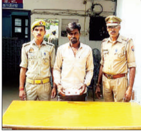
सीसीटीवी फुटेज की मदद से आरोपी को गिरफ्तार कर लिया गया है। उसके पास से सोने कुंडल और घटना में प्रयुक्त बाइक बरामद हुई है।