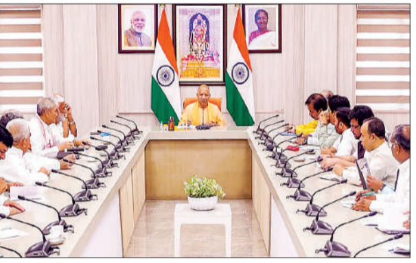
टेक्सटाइल और अपैरल सेक्टर में बड़े खिलाड़ी तैयार

ऑटोमोबाइल और इलेक्ट्रॉनिक सेक्टर में नई ऊर्जा सोसाइटी ऑफ इंडियन ऑटोमोबाइल मैनुफैक्चरर्स, एसीएमए, एसएमईवी और एआरआई जैसी संस्थाओं के सहयोग से प्रदेश में ऑटोमोबाइल उद्योग को नई रफ्तार मिल रही है। अशोक लेलेड, मिंडा और टाटा मोटर्स (विस्तार परियोजना) जैसे दिग्गज निवेश के लिए तैयार हैं।