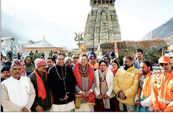
जान एक्सप्रेस। देहरादून

दिल्ली में बिहार के 3 बदमाशों का एनकाउंटर