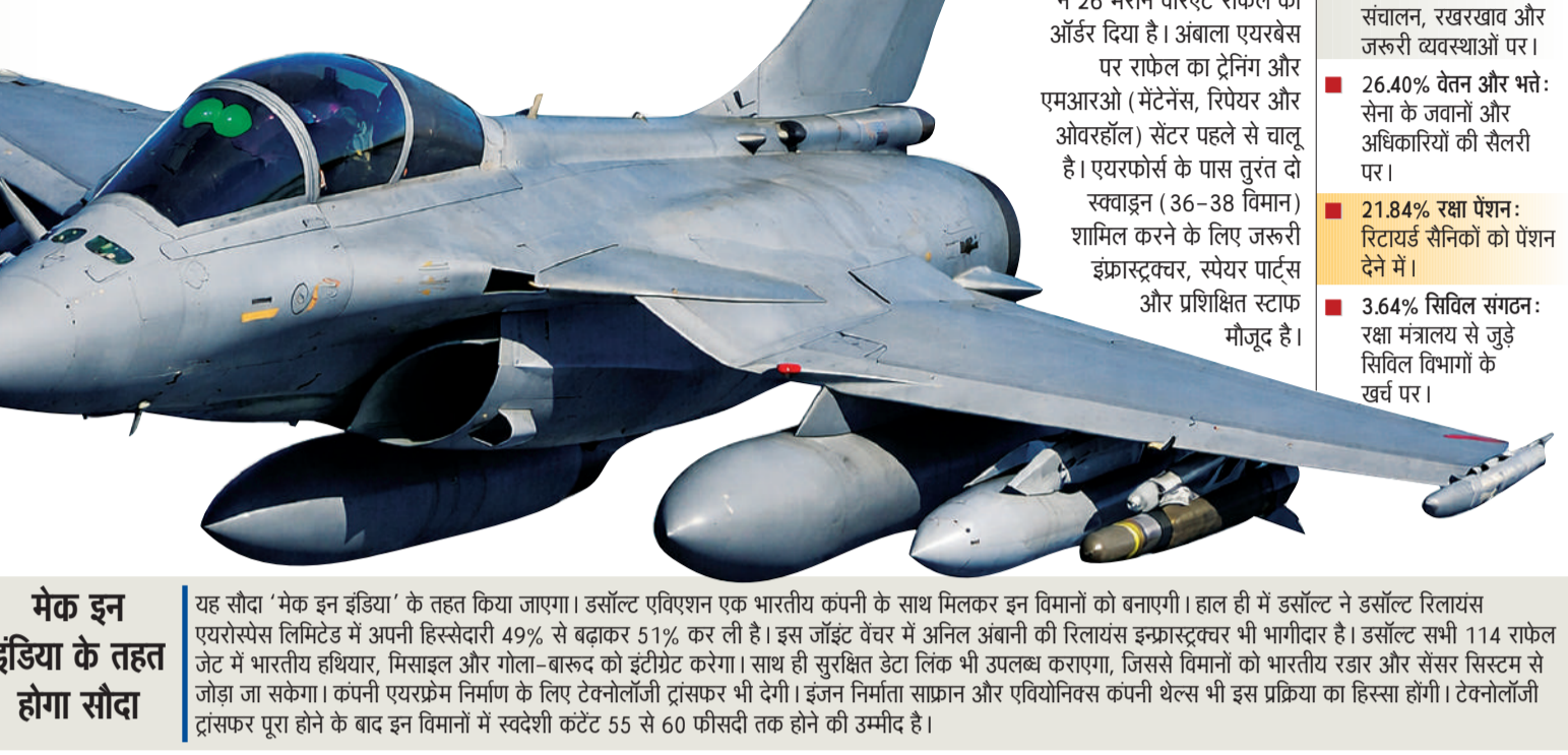
यह सौदा 'मेक इन इंडिया' के तहत किया जाएगा। इससे एयरिफान एक भारतीय कंपनी के साथ मिलकर इन विमानों को बनाएगी। हाल ही में इससेल्ट ने इससेल्ट रिलायंस एयरोस्पेस लिमिटेड में अपनी हिस्सेदारी 49% से बढ़ाकर 51% कर ली है। इस जॉइंट वेंचर में अनिल अंबानी की रिलायंस इन्फ्रास्ट्रक्चर भी भागीदार है। इससेल्ट सभी 114 राफेल जेट में भारतीय हथियार, मिसाइल और गोला-बारूद को इंटीग्रेट करेगा। साथ ही सुरक्षित डेटा लिंक भी उपलब्ध कराएगा, जिससे विमानों को भारतीय रडार और सेंसर सिस्टम से जोड़ा जा सकेगा। कंपनी एयरफ्रेम निर्माण के लिए टेक्नोलॉजी ट्रांसफर भी देगी। इंजन निर्माता साफ्रान और एवियोनिक्स कंपनी थेलस भी इस प्रक्रिया का हिस्सा होगी। टेक्नोलॉजी ट्रांसफर पूरा होने के बाद इन विमानों में स्वदेशी कंटेंट 55 से 60 फीसदी तक होने की उम्मीद है।

राफेल डील की खास बातें इस डील के अनुसार, भारत फ्रांस की कंपनी इससेल्ट एविएशन से 18 राफेल विमान खरीदेगा। बाकी 96 विमान भारत में ही बनाए जाएंगे। इनमें से कुछ विमान दो सीट वाले होंगे, जिनका