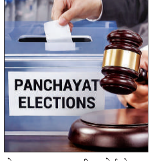
होगा। यह कदम सुप्रीम कोर्ट के उन निर्देशों के चलन में उठाया गया है, जिनमें स्थानीय निकाय चुनावों से पहले समर्पित आयोग का होना अनिवार्य बताया गया है।