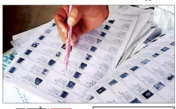
जन एक्सप्रेस। लखनऊ

उत्तर प्रदेश में मतदाता सूची के विशेष प्रगाढ़ पुनरीक्षण (एसआईआर) के 1.09 करोड़ मतदाताओं को नोटिस जारी कर दिया गया है। दो दिन में इन मतदाताओं को आपत्तियाँ दर्ज करानी होंगी। उसी आधार पर सुनवाई होगी। नोटिस देने की प्रक्रिया लगातार जारी रहेगी। मुख्य निर्वाचन अधिकारी नवदीप रिणवा ने बताया कि 6 जनवरी 2026 को प्रकाशित आलेख्य मतदाता सूची में 'नो मैपिंग' के 1.04 करोड़ और 'ताकिक विसंगतियों' के 2.22 करोड़ सहित कुल 3.26 करोड़ मतदाताओं को नोटिस जारी किए जाने हैं। अब तक करीब 1.09 करोड़ नोटिस जारी किए