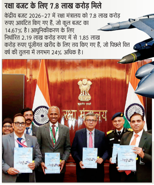
मेक इन इंडिया के तहत होगा सौदा

जन एक्सप्रेस/एजेंसी। नई दिल्ली भारत की रक्षा अधिग्रहण परिषद ने गुरुवार को फ्रांस से 114 राफेल लड़ाकू विमान खरीदने के प्रस्ताव को मंजूरी दे दी। इस डील की कीमत करीब 3.25 लाख करोड़ रुपये बताई जा रही है। अब यह प्रस्ताव अंतिम मंजूरी के लिए कैबिनेट कमेटी और सिविलियरी के पास भेजा जाएगा। वहीं, फ्रांस के राष्ट्रपति इमैनुएल मैक्रों के 17-20 फरवरी के 3 दिवसीय भारत दौरे पर सौदा हो सकता है। प्रस्ताव को 16 जनवरी को रक्षा खरीद बोर्ड से मंजूरी मिल चुकी थी। रक्षा मंत्रालय के मुताबिक, नए राफेल विमानों की खरीद से एयर डिफेंस और बॉर्डर एरिया में तैनाती की क्षमता मजबूत होगी। रक्षा मंत्रालय के मुताबिक, राजनाराय सिंह की अध्यक्षता वाली कमेटी ने कॉन्वैट मिसाइलों और एयर-शिप बेस्ड हाई एल्टीट्यूड स्ट्यूडेंट सैटेलाइट्स के प्रोजेक्ट को भी मंजूरी दी है। इन सभी सौदों की कुल कीमत 3.60 लाख करोड़ रुपये है।