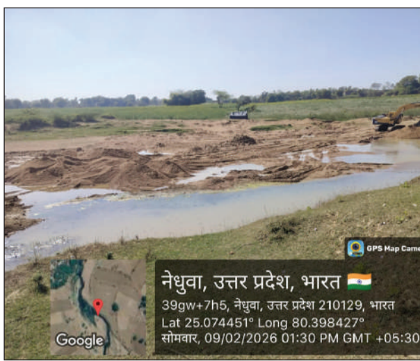
नेधुवा, उत्तर प्रदेश, भारत 39gw+7h5, नेधुवा, उत्तर प्रदेश 210129, भारत Lat 25.074451° Long 80.398427° सोमवार, 09/02/2026 01:30 PM GMT +05:30