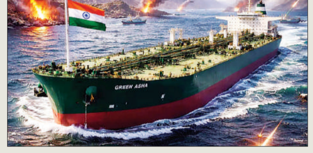
भारतीय झंडे वाला एलपीजी टैंकर 'ग्रीन आशा' 15,400 टन गैस लेकर भारत पहुंचा है।