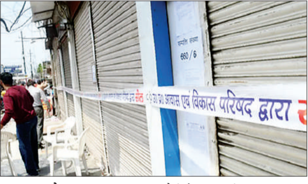
जन एक्सप्रेस। मुजफ्फरनगर