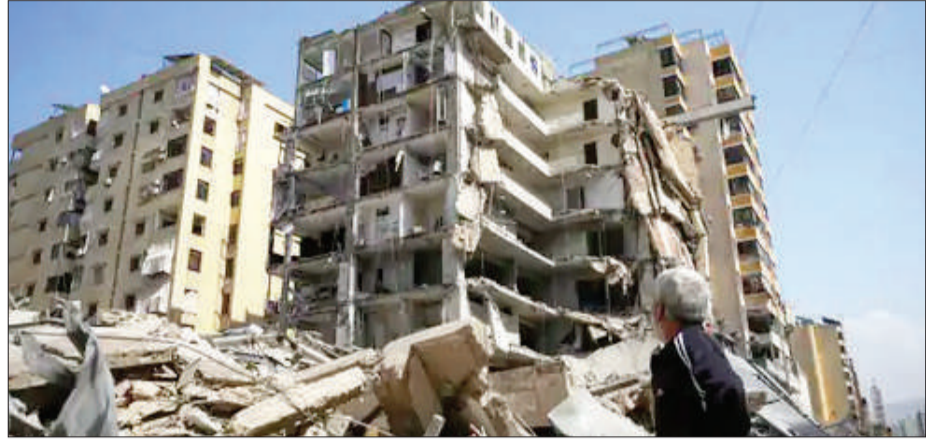
लेबनान में इजराइली हमलों से एक दिन में 254 मौतें

ईरान ने अमेरिका पर सीजफायर की तीन अहम शर्तें तोड़ने का आरोप लगाया है। ईरानी संसद के स्पीकर मोहम्मद बाकेर गालिबाफ ने कहा कि अमेरिका ने 10-पॉइंट प्रस्ताव की बुनियादी शर्तों का उल्लंघन किया है। ईरान ने साफ कहा है कि जिस आधार पर बातचीत होनी थी, वही पहले ही टूट चुका है। ऐसे में अब बातचीत या सीजफायर तर्कसंगत नहीं रह गया है। वहीं, अमेरिकी राष्ट्रपति डोनाल्ड ट्रम्प ने कहा है कि जब तक ईरान के साथ हुआ समझौता पूरी तरह लागू नहीं होता, तब तक अमेरिकी सेना ईरान के आसपास तैनात रहेंगी। ट्रम्प ने दृढ़ सोशल पर पोस्ट कर चेतावनी दी कि अगर समझौते का पालन नहीं हुआ, तो फिर से गोलीबारी शुरू होगी, जो पहले से ज्यादा बड़ी, ताकतवर और विनाशकारी होगी। हालांकि उन्होंने कहा कि इसकी संभावना बेहद कम है, लेकिन अमेरिका पूरी तरह तैयार है।