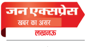
खबर का असर लखनऊ

6.45 करोड़ के टैंडर पर एक्शन के बाद विभाग में मचा हड़कंप; जिम्मेदारों की भूमिका खंगालने में जुटा प्रशासन