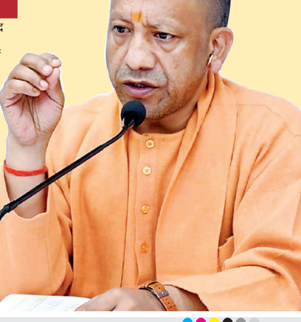
बाजार की मांग के अनुरूप तैयार करें उत्पाद

डिजाइन और विपणन को सुदृढ़ बनाने पर जोर देते हुए मुख्यमंत्री ने कहा कि उत्पाद की सफलता बाजार की मांग के अनुरूप होने पर ही संभव है। उन्होंने 'डिजाइनर-कम-मार्केटिंग एग्रीक्यूल्चर' तथा 'डिजाइन हाउस/सिस्टम-बाईंग एजेंसी/एक्सपोर्ट हाउस' जैसे संस्थागत तंत्र को प्रभावी रूप से लागू करने के निर्देश दिए। इससे उत्पादों की गुणवत्ता में सुधार, बड़े बाजारों तक पहुंच और बुनकरों की आय में वृद्धि सुनिश्चित होगी। मुख्यमंत्री ने डिजिटल प्लेटफॉर्म, ई-कॉमर्स और ब्रांडिंग के विस्तार पर विशेष ध्यान देने को कहा, ताकि बुनकरों को सीधे उपभोक्ताओं से जोड़ा जा सके। बैठक में मुख्यमंत्री ने पॉवरलूम बुनकरों के विद्युत बिल में कमी लाने के लिए बेहतर प्रयासों को जरूरत भी बताई। मुख्यमंत्री के निर्देश पर इस संबंध में हतकरधा विभाग और पॉवर कॉर्पोरेशन मिलकर कार्ययोजना तैयार करेंगे। मुख्यमंत्री ने सौर ऊर्जा को बढ़ावा देने पर विशेष बल देते हुए कहा कि इससे बुनकरों की विद्युत लागत में कमी आएगी और उन्हें दीर्घकालिक राहत मिलेगी। उन्होंने इस दिशा में प्रभावी कार्ययोजना तैयार करने के निर्देश दिए।