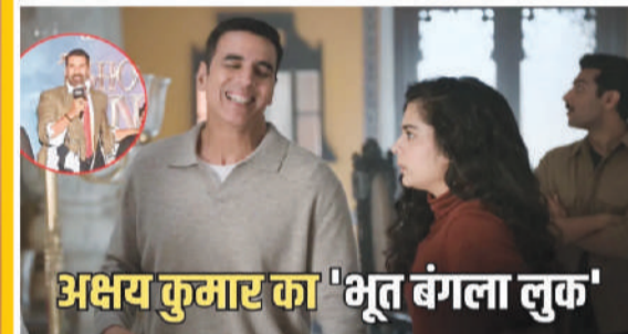
अक्षय कुमार का 'भूत बंगला लुक'

भूतों ने स्टाइल किया... ट्रेलर से ज्यादा अक्षय कुमार का लुक चर्चा में, Bhooth Bangla इवेंट में फटी शर्ट पहनने पर हुए ट्रोल्