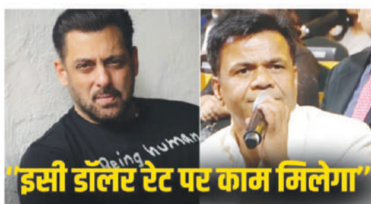
"इसी डॉलर रेट पर काम मिलेगा"

साल से काम कर रहे हैं और हम सबने आपको बार-बार इसलिए चुना है क्योंकि आप अपना काम अच्छी तरह जानते हैं। और उसमें एक वैल्यू लाते हैं। आपको काम की कोई कमी नहीं होगी, और इसी डॉलर रेट पर आपको काम मिलता रहेगा और मिलता रहेगा, यही हकीकत है। और यह याद रखना कि कभी-कभी बहाव में कुछ बातें निकल जाती हैं। अगर देना ही है तो दिमाग में रखो और दिल से काम करो।