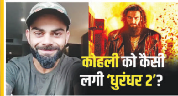
कोहली को कैसी लगी 'धुरंधर 2'?

विराट कोहली ने किया 'धुरंधर 2' का रिव्यू, 1600 करोड़ कमा चुकी फिल्म पर क्या कहा?