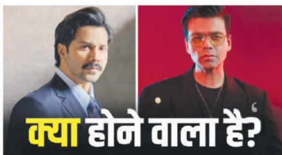
क्या होने वाला है?

‘हे जवानी तो इश्क होना है’ सबसे पहले 5 जून को रिलीज होने के लिए तय हुई थी, लेकिन जब ऐसी खबर आई कि 4 जून को यश की ‘टॉक्सिक’ रिलीज होगी, तो फिर वरुण की फिल्म की रिलीज डेट आगे बढ़ाकर 12 जून कर दी गई। इसी तारीख पर दिलजीत दोसांड, शरवरी वाघ और वेदांग रैना की भी एक फिल्म आने वाली है, जिसे इम्तियाज अली ने डायरेक्ट किया है। नाम है ‘मैं वापस आऊंगा’। अब बॉलीवुड हंगामा की एक रिपोर्ट में सूत्र के हवाले से बताया गया कि ‘हे जवानी तो इश्क होना है’ के मेकर्स को लगता है कि वो अपनी इस फिल्म को पहले रिलीज कर सकते हैं, क्योंकि उनको पिछर पूरी तरह