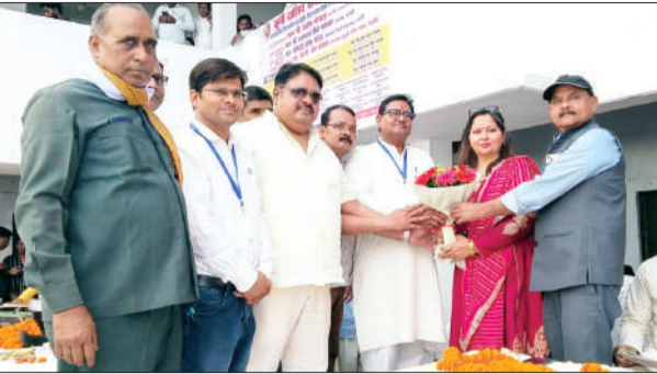
जन एक्सप्रेस। मुकेश कुमार

पीलीभीत। जनपद बरेली में कुर्मी क्षत्रिय सभा द्वारा आयोजित 18वां सजातीय सामूहिक विवाह समारोह सामाजिक एकता, सहयोग और परिवारिक मूल्यों को एक सशक्त मिसाल बनकर सामने आया। कार्यक्रम में अनेक जोड़ों ने एक साथ वैवाहिक जीवन की नई शुरुआत की, जहां पूरे वातावरण में उत्साह, सादगी और पारंपरिक संस्कारों की झलक स्पष्ट दिखाई दी। सुबह से ही आयोजन स्थल पर तैयारियों का दौड़ जारी था। वैवाहिक रस्मों का शुरुआत होते ही एक-एक कर वर-वधू ने सात फेरों के साथ जीवन भर साथ निभाने का संकल्प लिया। इस दौरान उपस्थित लोगों ने पुष्पवर्षा कर नवदंपतियों को आशीर्वाद दिया और उनके उज्वल भविष्य की कामना की। सामाजिक समरसता का मजबूत संदेश