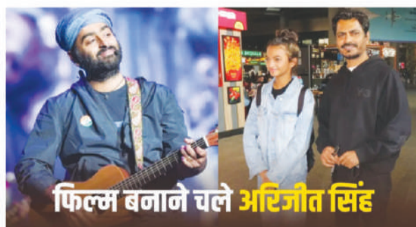
फिल्म बनाने चले अरिजीत सिंह