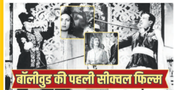
बॉलीवुड की पहली सीक्रेल फिल्म

91 साल पहले शुरू हुआ था बॉलीवुड में सीक्रेल का दौर, एक महिला एक्शन स्टार ने रचा था इतिहास