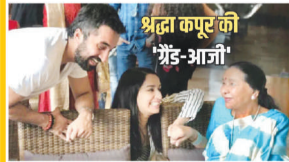
श्रद्धा कपूर की 'प्रीटि-आजी'

आशा भोसले से खास रिश्ता रखती हैं श्रद्धा कपूर, मंगेशकर परिवार से क्या है कनेक्शन